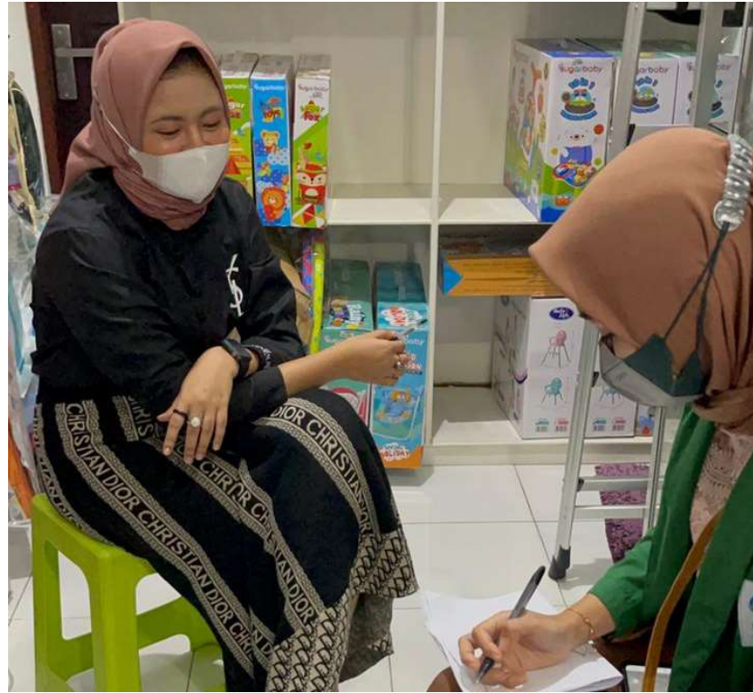
Wawancara bersama Karyawan Bank Syariah Indonesia