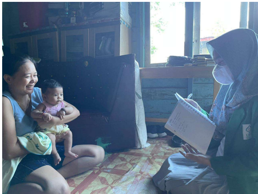
Wawancara bersama Ibu Septi