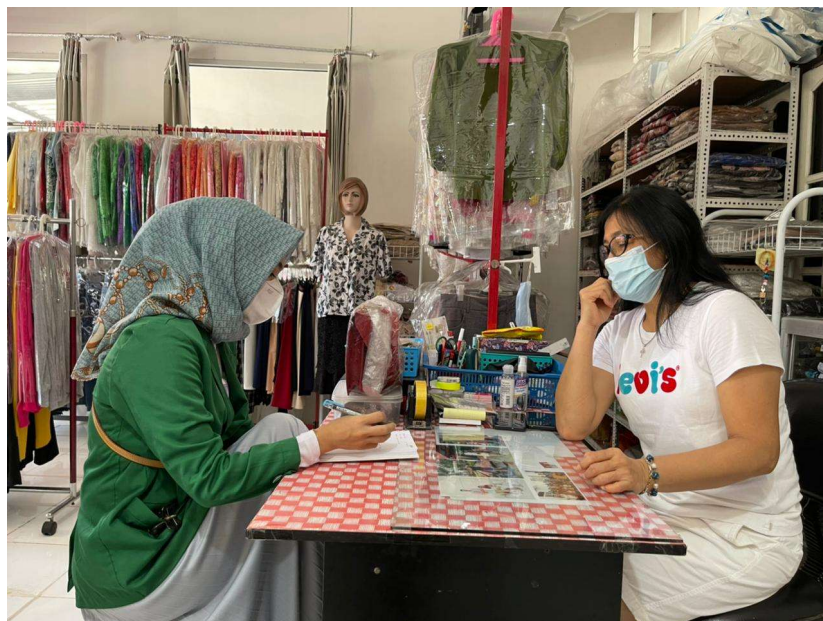
Wawancara Bersama Ibu Ferry