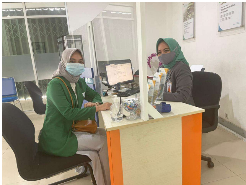
Wawancara bersama Karyawan Bank Syariah Indonesia