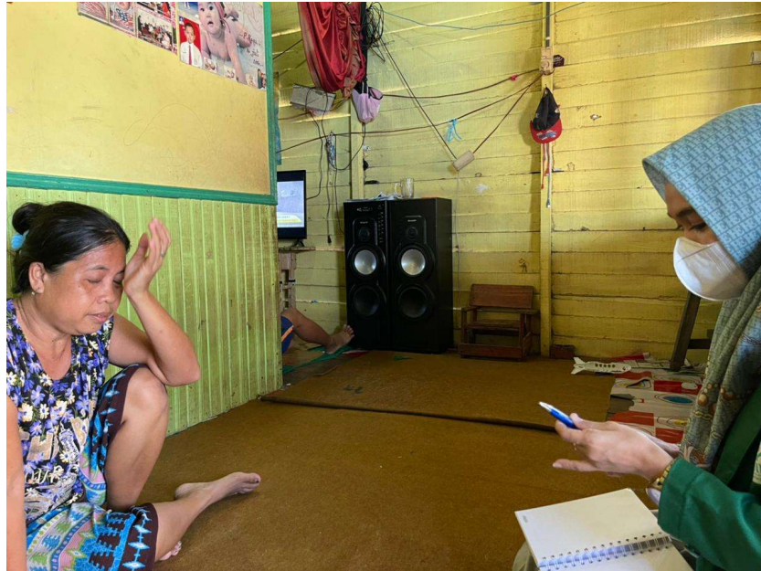
Wawancara bersama Ibu Deni