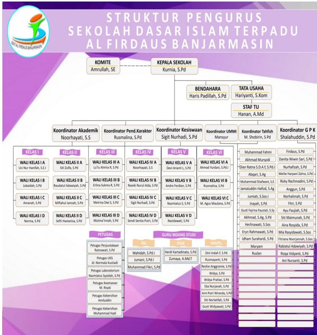
Struktur Pengurus SDIT Al-Firdaus Banjarmasin