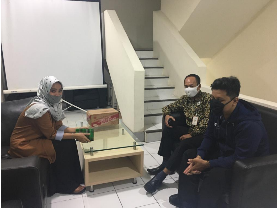
Foto dokumentasi melakukan interview / wawancara penelitian awal bersama karyawan Bank BNI Syariah KC Banjarbaru