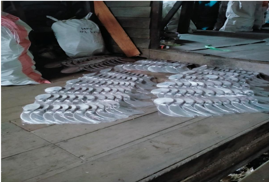
Roda untuk perahu