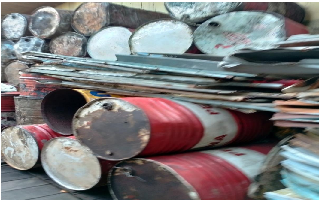
Bahan untuk membuat panggangan