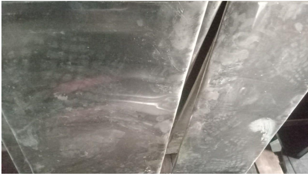
Sukrinjing yang diproduksi di tempat bapa Sahyaran