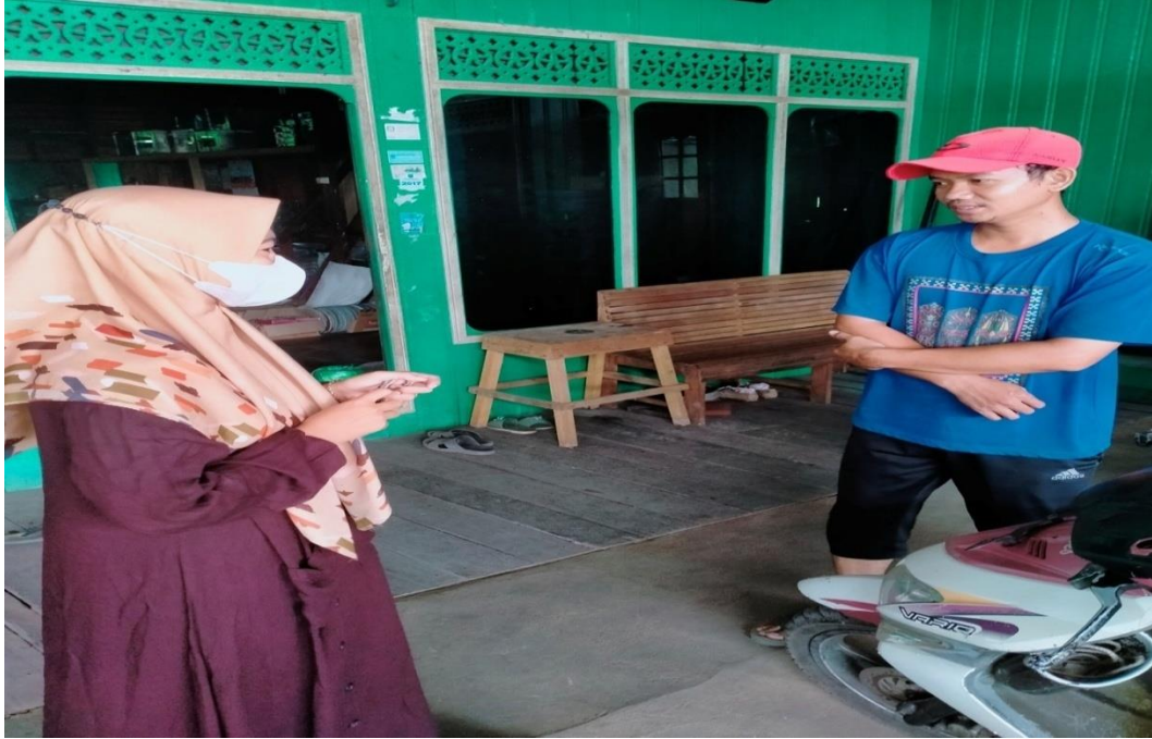
Bahan untuk pembuatan wajan dan roda kapal