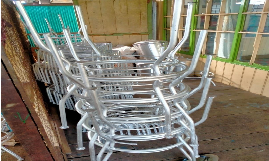
Tungku besi untuk kompor gas tungku dua