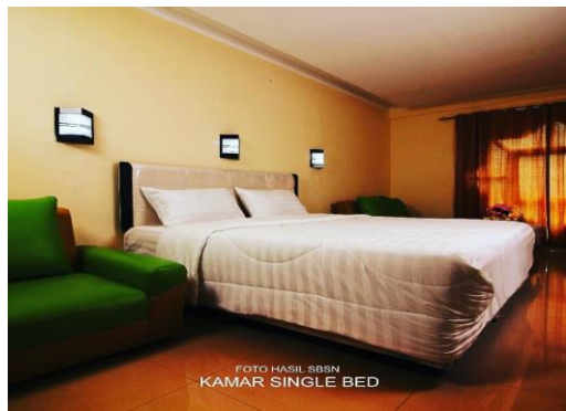
Fasilitas kamar menginap