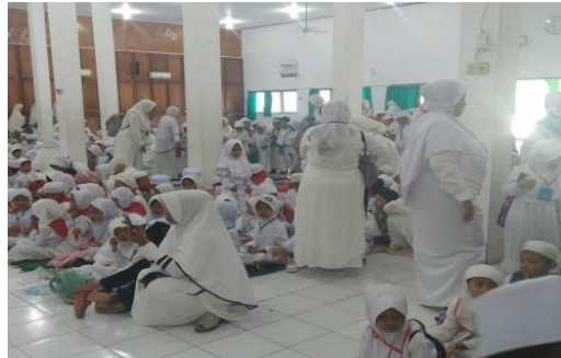
Rangkaian kegiatan Manasik haji bersama Gugus Merah Delima Kec. Banjarbaru utara