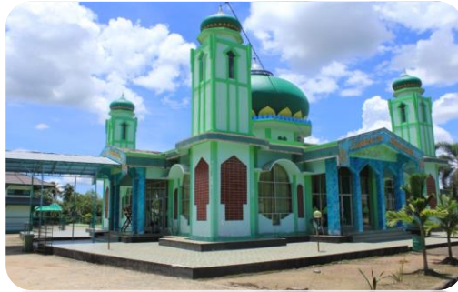
Mesjid SYAHRAZZA MUHTADIN