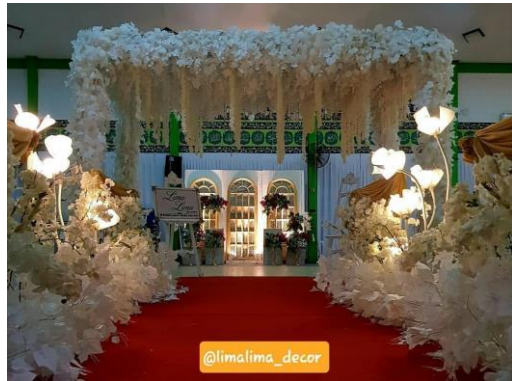
Wedding Ceremony dari @ammhmmd dan @sorayanch