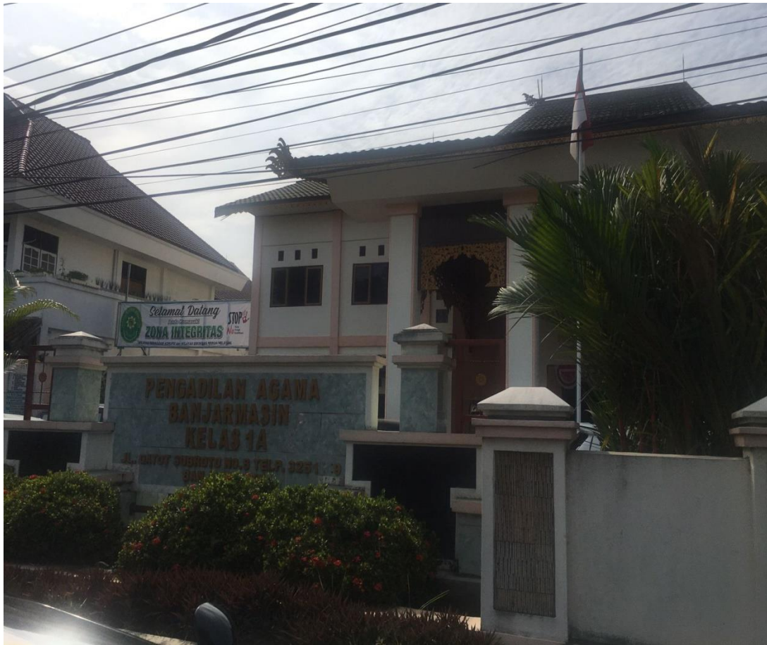
Halaman Depan Pengadilan Agama Banjarmasin Kelas 1A