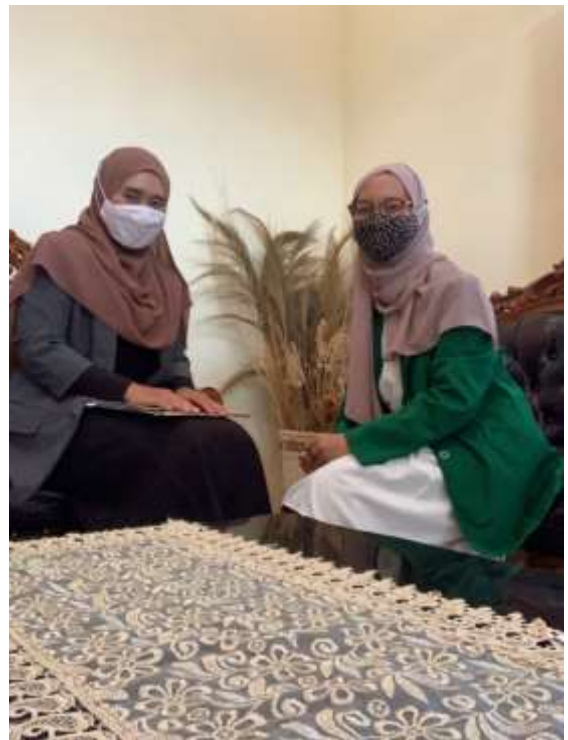
Penyerahan surat riset ke Bank BRI KC Buntok