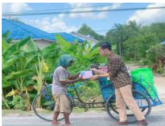
gambar 4.5. kegiatan program memberi sembako oleh YBM BRI KC Buntok

Pada gambar 4.3 dan gambar 4.4 merupakan program kurban dan menjadi salah satu program yang dijalankan di YBM BRI di BRI KC Buntok dan masih aktif dilaksanakan tiap tahun saat hari raya idul adha. Daging hasil kurban akan dibagikan di sekitar lingkungan perusahaan atau sekitar BRI KC Buntok, dari program ini masyarakat sangat berterimakasih karena dapat memakan daging kurban dan dari pihak YBM BRI berharap daging yang diberikan dapat bermanfaat dan berkah. Ini merupakan data untuk rumusan masalah nomor 1 untuk mengetahui bagaimana bentuk penyaluran program YBM BRI di BRI KC Buntok dan yang rumusan masalah untuk mengetahui bagaimana program YBM BRI berefek atau berdampak bagi kesejahteraan masyarakat.