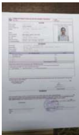
gambar 4.10. formulir untuk bantuan marbot masjid

Gambar 4.9 dan gambar 4.10 merupakan bantuan program marbot masjid berupa dana bantuan antara Rp. 300.000- 500.000 perbulan dan gambar satunya adalah formulir pendaftaran untuk bantuan program marbot masjid, ini bertujuan untuk membantu perekonomian para marbot dan menambah pemasukan bagi marbot selain pemberian yang diberikan oleh para donator masjid Ini merupakan data untuk rumusan masalah nomor 1 untuk mengetahui bagaimana bentuk penyaluran program YBM BRI di BRI KC Buntok dan yang rumusan masalah nomor 2 untuk mengetahui bagaimana program YBM BRI berefek atau berdampak bagi kesejahteraan masyarakat.