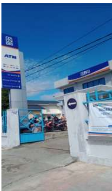
gambar 4.1. Bank BRI KC Buntok

Seiring dengan adanya peraturan dari Bank Rakyat Indonesia (BRI) muncul lah YBM BRI di setiap BRI dari kantor cabang sampai ke kantor cabang pembantu diseluruh Indonesia. YBM BRI KC Buntok beralamatkan di Jl. Panglima Batur No. 10, Buntok Kota, Kecamatan Dusun Selatan, Kabupaten Barito Selatan, Kalimantan Tengah, Indonesia. Dikelola oleh bagian Human Capital BRI KC Buntok.