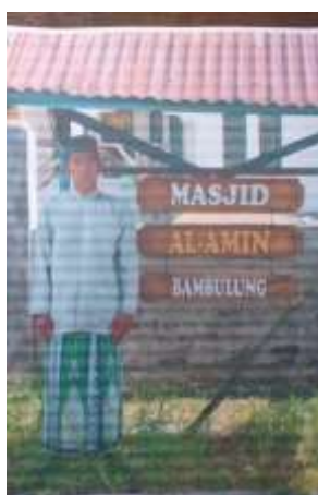
gambar 4.9. foto penerima bantuan marbot masjid

Kemudian gambar 4.8 merupakan program tanggap bencana yaitu bantuan untuk masyarakat yang terdampak banjir Kalsel yang diberikan berupa bantuan sembako, kenapa ini merupakan data untuk rumusan masalah nomor 1 untuk mengetahui bagaimana bentuk penyaluran program YBM BRI di BRI KC Buntok dan yang rumusan masalah nomor 2 untuk mengetahui bagaimana program YBM BRI berefek atau berdampak bagi kesejahteraan masyarakat