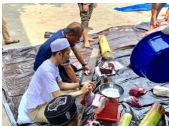
gambar 4.4. kegiatan program Kurban oleh YBM BRI KC Buntok

Pada gambar 4.3 dan gambar 4.4 merupakan program kurban dan menjadi salah satu program yang dijalankan di YBM BRI di BRI KC Buntok dan masih aktif dilaksanakan tiap tahun saat hari raya idul adha. Daging hasil kurban akan dibagikan di sekitar lingkungan perusahaan atau sekitar BRI KC Buntok, dari program ini masyarakat sangat berterimakasih karena dapat memakan daging kurban dan dari pihak YBM BRI berharap daging yang diberikan dapat bermanfaat dan berkah. Ini merupakan data untuk rumusan masalah nomor 1 untuk mengetahui bagaimana bentuk penyaluran program YBM BRI di BRI KC Buntok dan yang rumusan masalah untuk mengetahui bagaimana program YBM BRI berefek atau berdampak bagi kesejahteraan masyarakat.