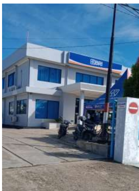
gambar 4.2. Bank BRI KC Buntok