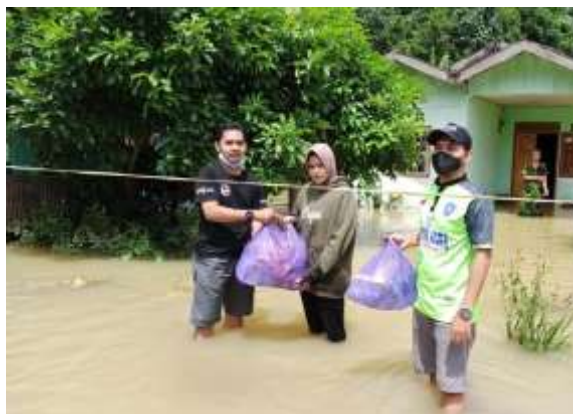
gambar 4.8. kegiatan program bantuan sembako terdampak banjir Kalsel oleh YBM BRI KC Buntok

Gambar 4.7 merupakan program bantuan usaha yang diberikan kepada ustadz, ini bertujuan untuk ustadz yang tidak memiliki modal atau terkendalanya perekonomian diharapkan agar dapat mandiri dan dapat mengembangkan usahanya sendiri.