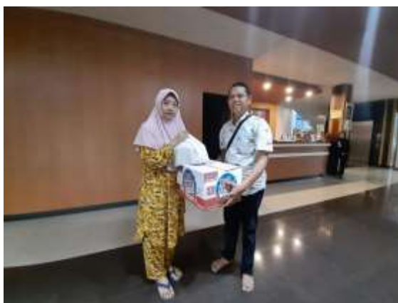
gambar 4.7. kegiatan program Bantuan usaha yang diberikan kepada ustadz oleh YBM BRI KC Buntok

Pada gambar 4.5 dan gambar 4.6 merupakan bentuk bantuan program YBM BRI nama programnya memberi sembako, masker ataupun makanan untuk masyarakat yang terdampak covid 19. Diharapkan dengan adanya bantuan program ini dapat membantu masyarakat yang terdampak. Program ini termasuk di program tanggap bencana. Ini merupakan data untuk rumusan masalah nomor 1 untuk mengetahui bagaimana bentuk penyaluran program YBM BRI di BRI KC Buntok dan yang rumusan masalah nomor 2 untuk mengetahui bagaimana program YBM BRI berefek atau berdampak bagi kesejahteraan masyarakat.