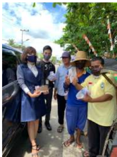
gambar 4.6. kegiatan program memberi masker dan makanan oleh YBM BRI KC Buntok

Pada gambar 4.5 dan gambar 4.6 merupakan bentuk bantuan program YBM BRI nama programnya memberi sembako, masker ataupun makanan untuk masyarakat yang terdampak covid 19. Diharapkan dengan adanya bantuan program ini dapat membantu masyarakat yang terdampak. Program ini termasuk di program tanggap bencana. Ini merupakan data untuk rumusan masalah nomor 1 untuk mengetahui bagaimana bentuk penyaluran program YBM BRI di BRI KC Buntok dan yang rumusan masalah nomor 2 untuk mengetahui bagaimana program YBM BRI berefek atau berdampak bagi kesejahteraan masyarakat.