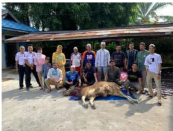
gambar 4.3. kegiatan program Kurban oleh YBM BRI KC Buntok

Berikut adalah dokumentasi foto kegiatan program YBM BRI KC Buntok, yaitu: