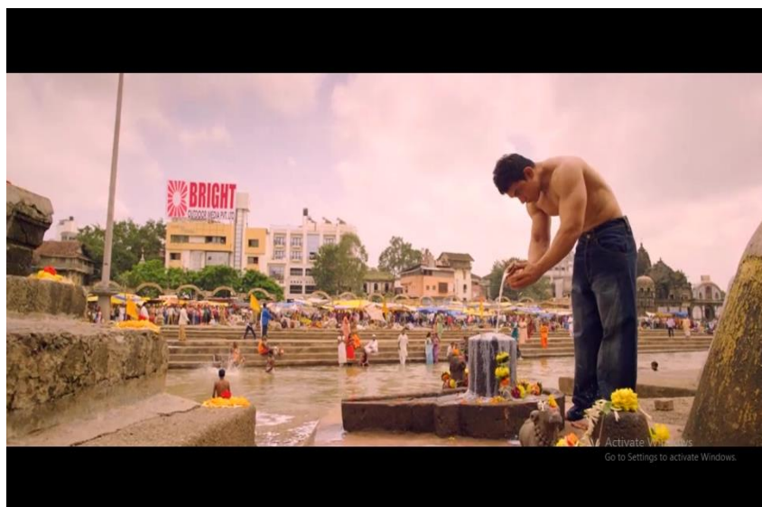
Gambar 6 adegan Pk melakukan ritual penyiraman susu pada batu suci