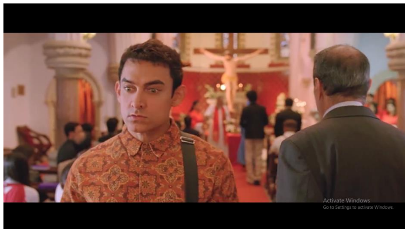
Gambar 10 adegan Pk pertama kali masuk Gereja untuk mencari Tuhan dalam agama Kristen

Diawali dengan Pk masuk Gereja kemudian untuk bisa bertemu Tuhan dalam agama ini Pk berupaya mengikuti berbagai ajaran keagamaan mulai dari di baptis lalu berkunjung dan berdo'a di Gereja dan sampai pada titik dimana lagi dan lagi Tuhan dalam agama ini masih belum bisa membantu Pk .