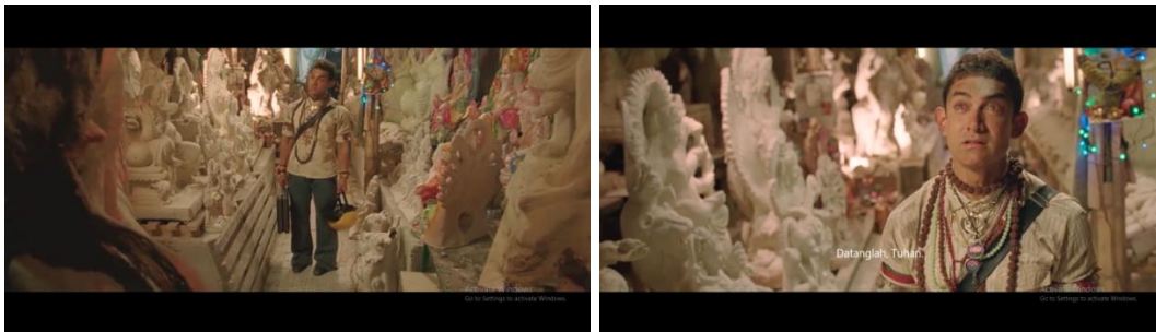
Gambar 17 adegan keputusan Pk karena tidak ada Tuhan yang dapat membantunya

Sampai pada menit 01:08:44 disini adegan utama yang penulis angkat yakni since dimana Pk putus asa dengan usahanya mencari Tuhan. Sepertinya yang diutarakan dalam film dimana Pk berkata: 3