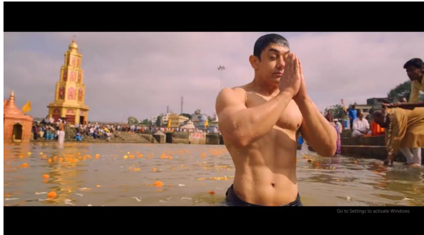
Gambar 5 adegan Pk berendam di sungai Gangga

bertemu dengan Tuhan dalam agama Hindu. Berikut adalah beberapa cuplikan Pk dalam pencariannya terhadap Tuhan dalam agama Hindu.