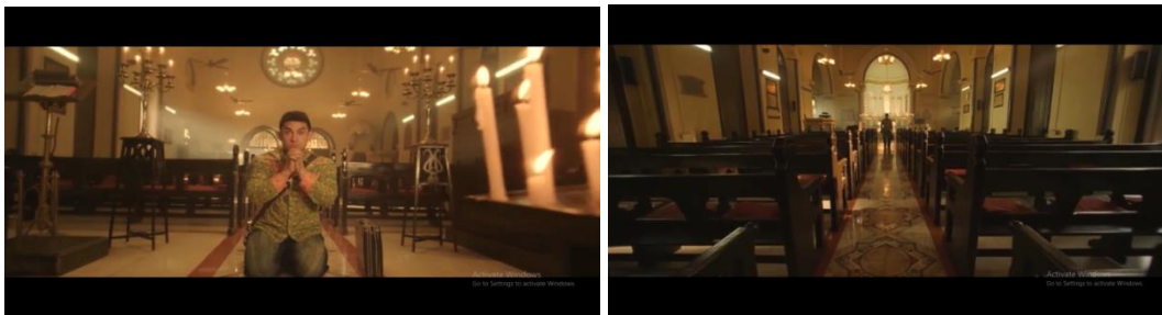
Gambar 12 adegan Pk beberapa kali ke Gereja untuk berdoa dan bertemu Tuhan

Puncak dari perjalanan Pk akan pencarian dirinya terhadap Tuhan yang dapat membantu permasalahannya yaitu memberikan petunjuk agar ia dapat menemukan kembali remote control -nya sampai pada satu titik dimana Pk telah mengikuti berbagai agama mulai dari Hindu, Islam, Kristen, dan beberapa agama kepercayaan yang ada di India lainnya. Namun dengan semua usaha yang telah ia keluarkan, ia tetap tidak mendapatkan bantuan maupun petunjuk dari berbagai Tuhan dalam agama itu padahal di awal ketika ia kehilangan remote control dan bertanya kepada orang-orang, semua menjawab sama yakni “hanya Tuhan yang dapat membantumu” namun pada kenyataannya ketika Pk telah mengikuti semua