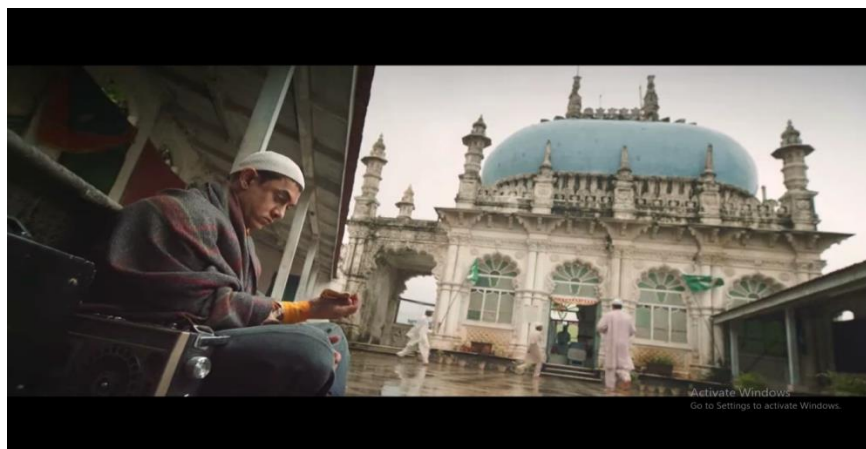
Gambar 16 adegan ketika Pk beri'tikaf di Mesjid