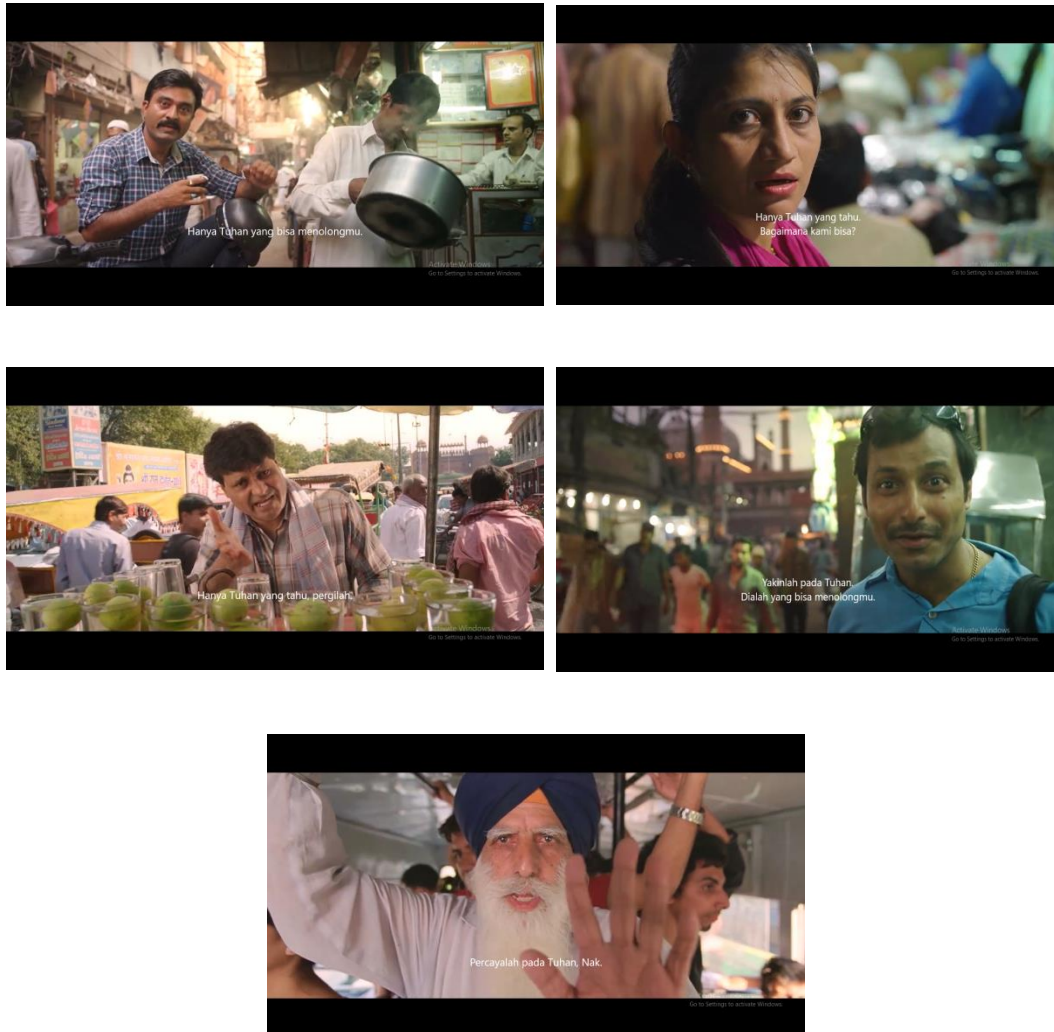
Gambar 13 adegan ketika orang-orang memberitahu hanya Tuhan yang bisa membantunya

ajaran Tuhan dari berbagai agama hasilnya tetap nihil dan Pk tidak mendapatkan apa yang ia cari melalui perantara pertolongan Tuhan.