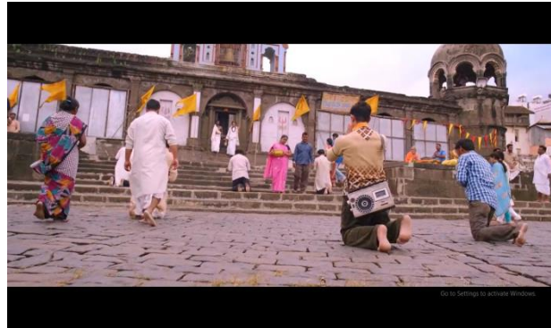
Gambar 9 adegan Pk mencoba mengikuti berbagai ritual dalam agama Hindu

Pencarian Pk akan Tuhan tidak hanya sampai pada agama mayoritas disana yaitu agama Hindu, namun perjalanan pencarian Tuhan ini berlanjut pada agama Islam. perjalanan ini dimulai dengan datangnya Pk menuju sebuah Mesjid untuk dapat bertemu Tuhan dalam agama Islam.