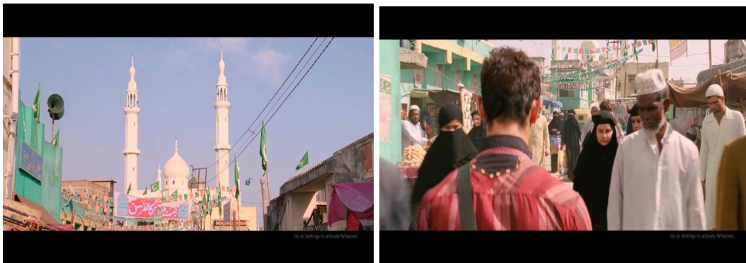
Gambar 13 adegan ketika Pk menuju mesjid untuk mencoba mencari Tuhan

Pencarian Pk akan Tuhan tidak hanya sampai pada agama mayoritas disana yaitu agama Hindu, namun perjalanan pencarian Tuhan ini berlanjut pada agama Islam. perjalanan ini dimulai dengan datangnya Pk menuju sebuah Mesjid untuk dapat bertemu Tuhan dalam agama Islam.