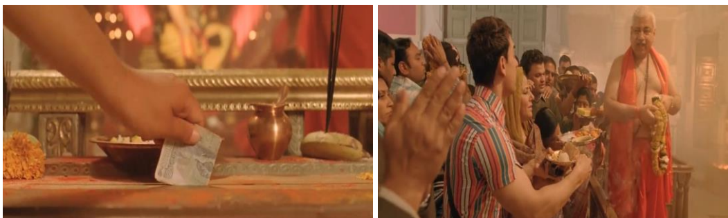
Gambar 3 adegan pertama kali Pk masuk kuil dan meminta pertolongan Tuhan

Pencarian Pk akan Tuhan dalam agama Hindu, diawali pada menit 52:36 dimana pada adegan ini diperlihatkan ia membeli sebuah patung yang diyakini sebagai Tuhan. Adegan ini juga memperlihatkan perdebatan antara si penjual patung dan Pk yang memperdebatkan apakah Tuhan yang menciptakan manusia atau manusia yang menciptakan Tuhan.