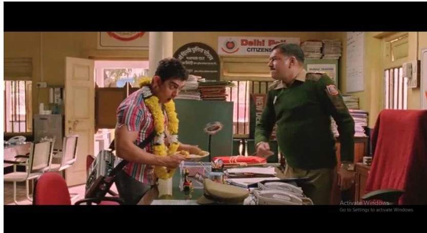
Gambar 4 adegan Pk melaporkan Tuhan pada pihak kepolisian

terselesaikan namun di dalam kuil itu Pk tidak bisa bertemu Tuhan bahkan permasalahannya pun sama sekali tidak terselesaikan.