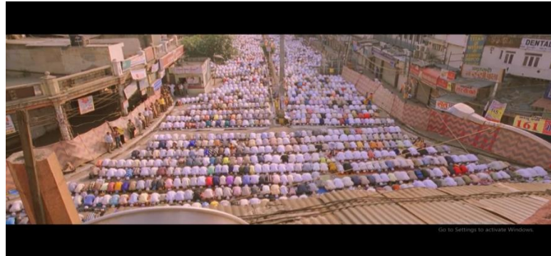
Gambar 14 adegan Pk mengikuti sholat berjama'ah agar bisa bertemu Tuhan