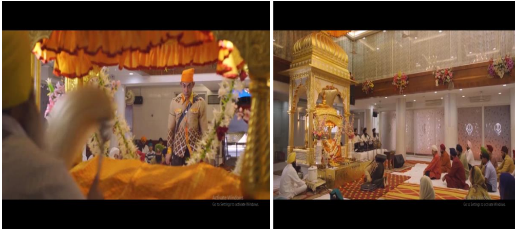
Gambar 7 adegan Pk berkunjung ketempat-tempat suci umat Hindu