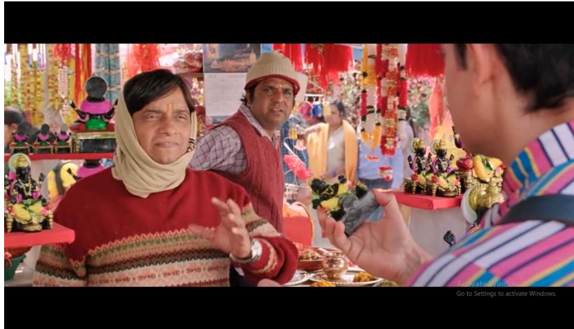
Gambar 2 adegan perdebatan antara Pk dan penjual patung

Pencarian Pk akan Tuhan dalam agama Hindu, diawali pada menit 52:36 dimana pada adegan ini diperlihatkan ia membeli sebuah patung yang diyakini sebagai Tuhan. Adegan ini juga memperlihatkan perdebatan antara si penjual patung dan Pk yang memperdebatkan apakah Tuhan yang menciptakan manusia atau manusia yang menciptakan Tuhan.