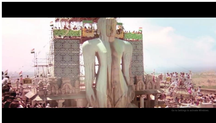
Gambar 8 adegan Pk mengikuti upacara pembersihan patung besar umat Hindu