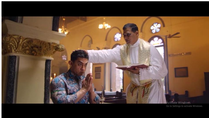
Gambar 11 adegan ketika Pk mengikuti ritual pembaptisan