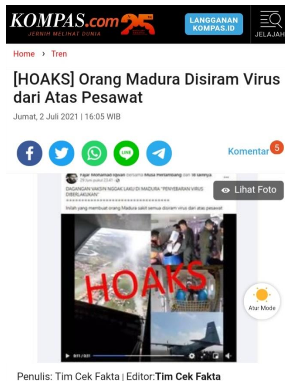
Gambar 4.10 Hoaks Orang Madura disiram Virus dari atas Pesawat

Video itu juga digabungkan dengan beberapa foto yang menunjukkan orang-orang berseragam hijau tengah menuangkan sesuatu ke drum berwarna biru dan juga foto pesawat. Sementara itu videonya hanya menampilkan benda cair yang disemprot dari ketinggian, seperti dari pesawat. Akun facebook FM juga menambahkan narasinya bahwa “dagangan vaksin nggak laku di Madura penyebaran virus di berlakukan” inilah yang membuat orang Madura sakit semua disiram virus dari pesawat.