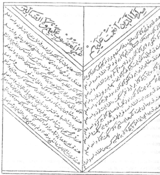
GAMBAR Dua buah daftar yang menyertai pal Qur'an dikopi (agak diperhecil) dari kitab HMI

Sebagai ilustrasi diberikan di sini sebuah contoh, yaitu umpamanya seorang client bertanya apakah lamaran seorang pemuda untuk anak gadisnya sebaiknya diterima atau tidak. Permasalahan ini dirumuskan kembali menjadi pertanyaan no. 32, yaitu “laki-laki itu baikkah atau tiadakah”, yang sejajar dengan potongan ayat “al-hamdulillahi rabb al-alamin”. Setelah membaca surah dan doa, sambil memejamkan mata menunjuk, umpamanya, angka 5. Ini berarti bahwa potongan ayat yang sejajar dengan pertanyaan tadi (menghitung sampai 5 mulai dari ayat yang sejajar dengan pertanyaan searah