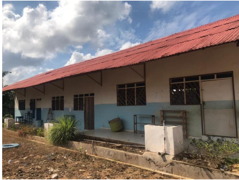
f. WC sekolah