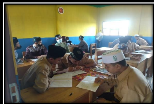
Foto Kegiatan Belajar menggunakan metode diskusi