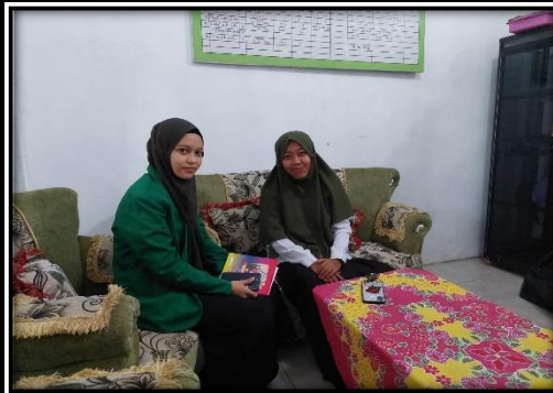
Foto bersama Kepala MA Wali Songo Banjarbaru