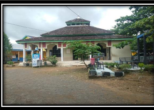
Foto Masjid MA Wali Songo