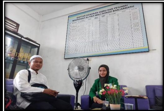
Foto Barsama Guru Fikih MA Wali Songo Banjarbaru