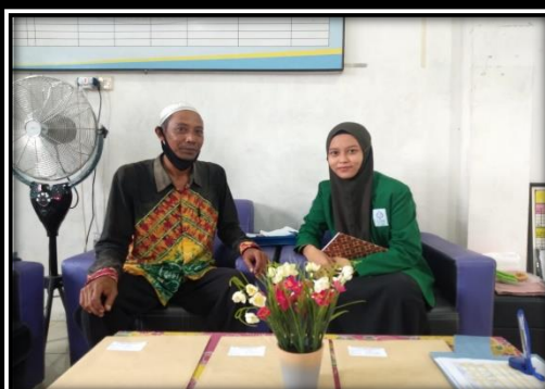
Foto bersama TU MA Wali Songo Banjarbaru