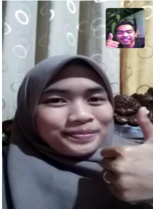
Dokumentasi bersama subjek