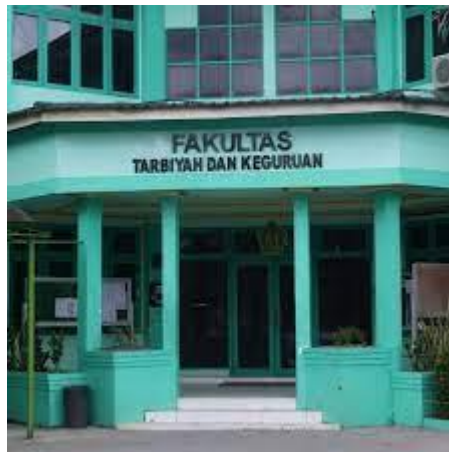
Kantor Fakultas Tarbiyah dan Keguruan Kampus UIN Antasari Banjarmasin