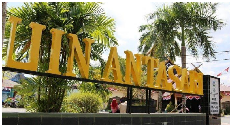
Taman Hijau Kampus UIN Antasari Banjarmasin