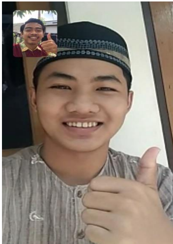
Dokumentasi bersama subjek