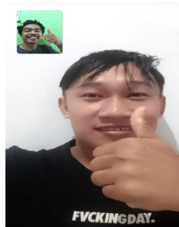
Dokumentasi bersama subjek