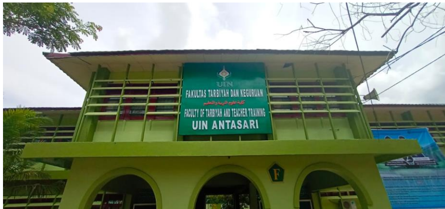
Gedung Fakultas Tarbiyah dan Keguruan Kampus UIN Antasari Banjarmasin