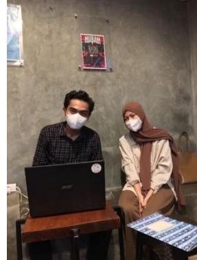
Dokumentasi bersama subjek