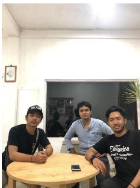
Dokumentasi bersama subjek