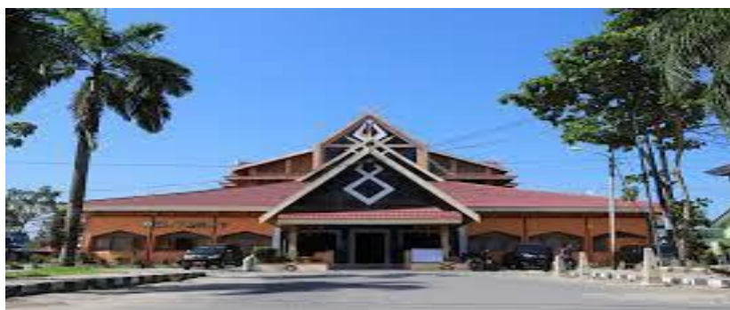
Gedung Rektorat Kampus UIN Antasari Banjarmasin