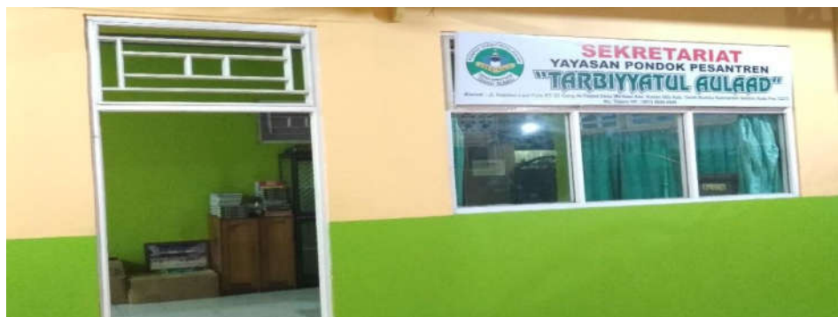
Kantor kesekretariatan pondok pesantren