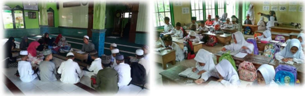
Foto kegiatan belajar mengajar program Diniyyah