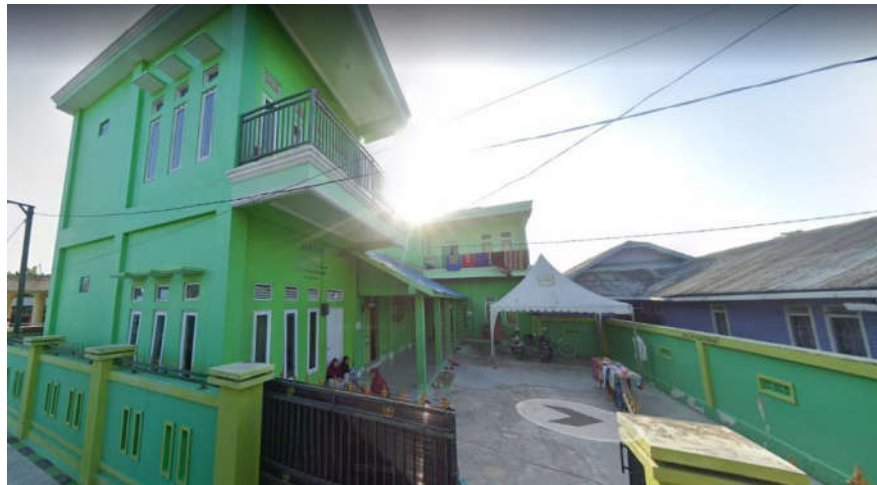
Gedung 3 Asrama Tahfiz Putri tampak depan