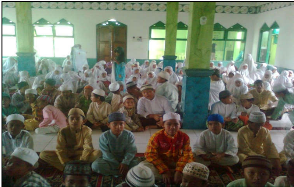
Foto Santri Sebelum melakukan Sholat Ashar Berjamaah