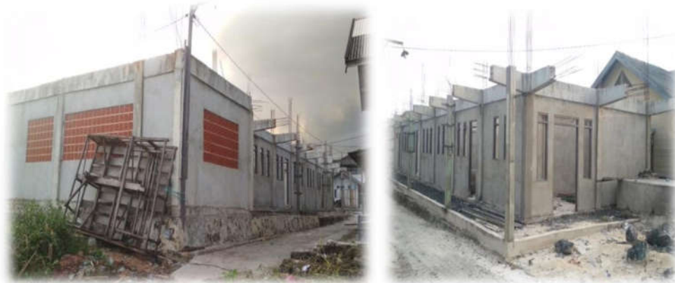
Foto pembangunan Gedung ke 4, Asrama Tahfiz Putra