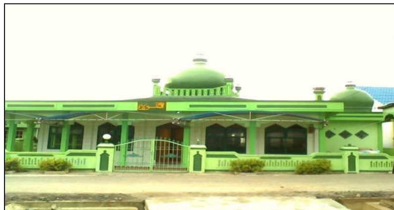
Mesjid AT-Taqwa tampak luar depan