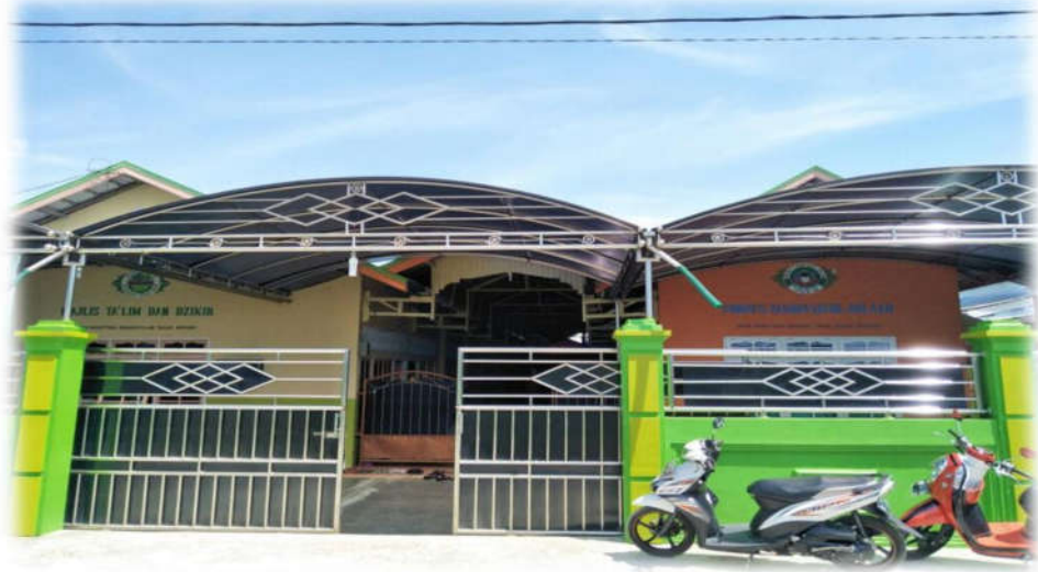
Gedung 2 pondok pesantren tampak depan