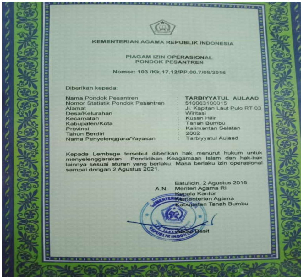
Foto Piagam izin operasional pondok pesantren