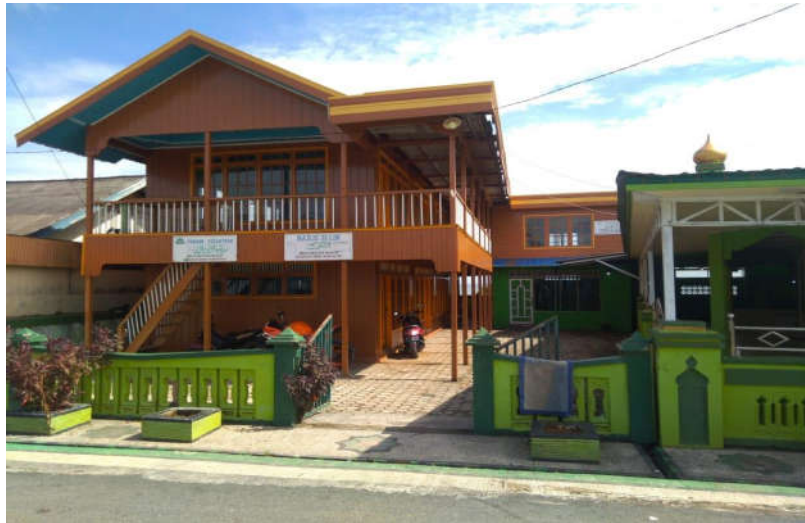
Gedung 1 pondok pesantren tampak depan