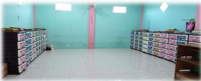
Foto Kamar Asrama Tahfiz Putri