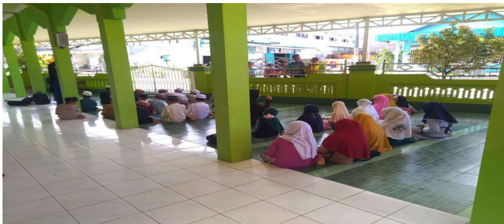
Foto kegiatan Praktek Sholat santri Program Diniyyah