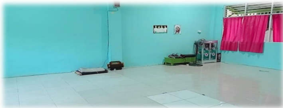
Foto Mushola Tahfiz Putri