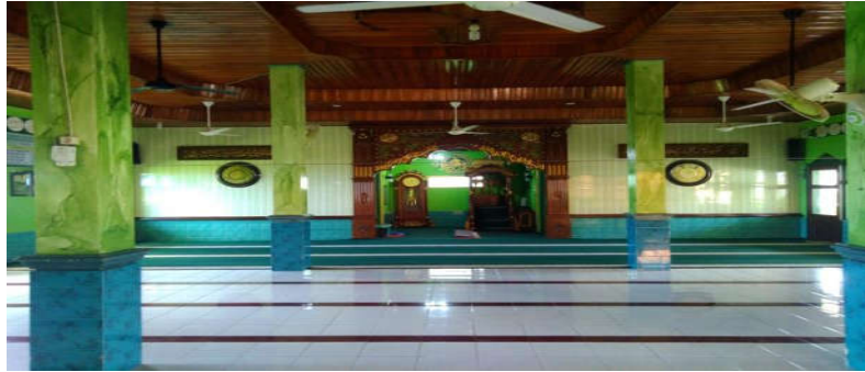
Fasilitas Masjid At-Taqwa tampak dalam