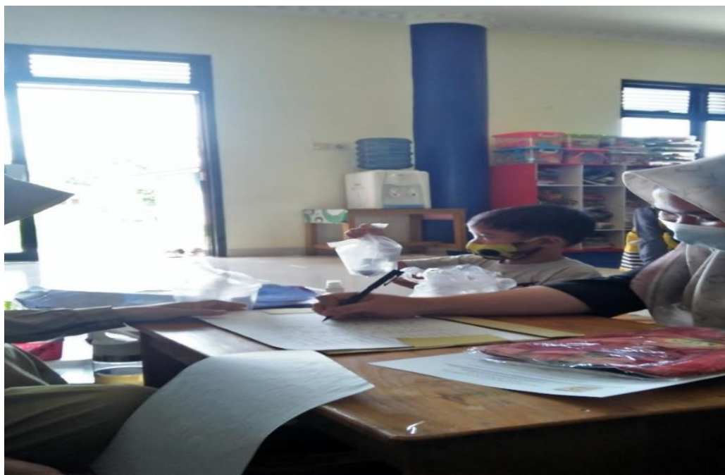
Gambar 4.2. Guru Mengarahkan Kegiatan di Rumah pada Orang tua

orangtua namun orangtua lah yang lebih berperan dalam memberikan arahan kepada anak. 11