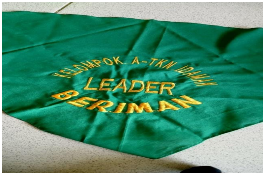
Gambar 4.4. Slayer Sebagai Leadership