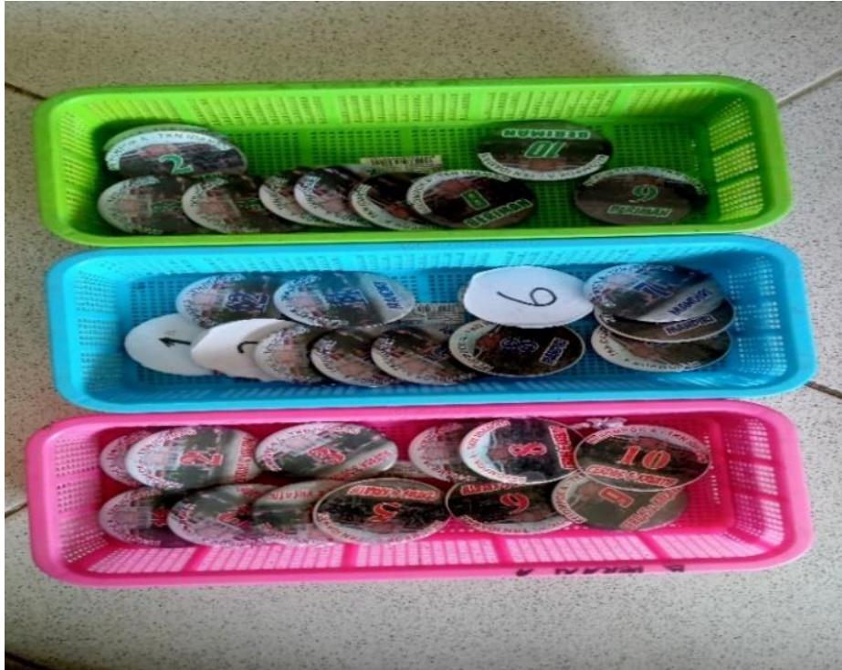
Gambar 4.3. Pin Nomor dalam Kegiatan Leadership

melatih kemandirian anak melalui metode leadership . Hal tersebut seperti slayer, pin, dan lembar kegiatan selama pembelajaran di rumah. 19