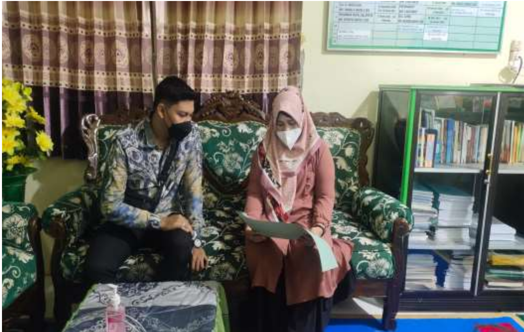
Gambar Lokasi Penelitian MTsN 9 Hulu Sungai Selatan