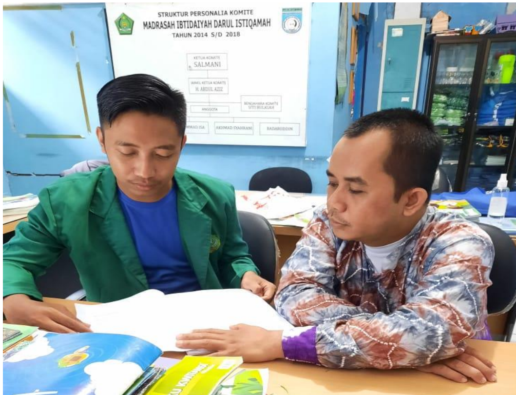
Wawancara dengan Peserta Didik dan Orang Tua Peserta Didik