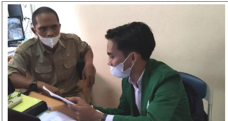
Wawancara dengan Pustakawan Perp. Keliling