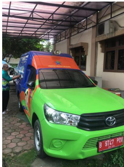
Unit Mobil Pintar Perp. Keliling