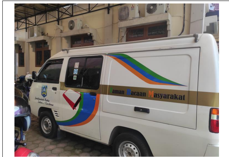
Unit Mobil Pintar Perp. Keliling