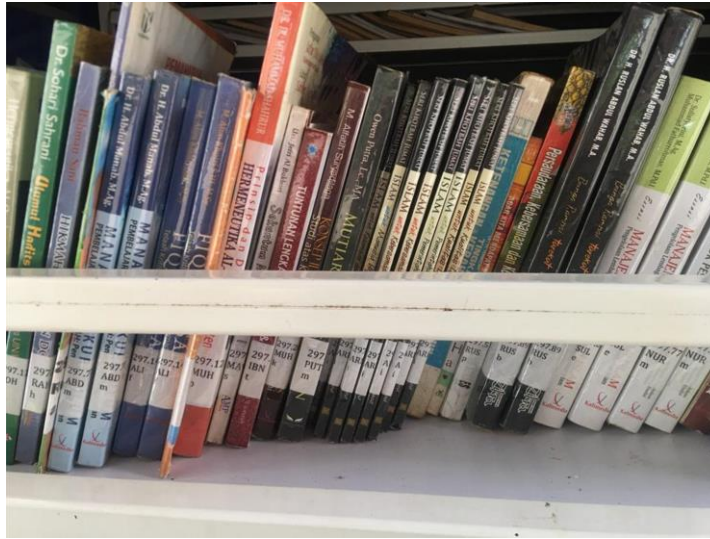
Koleksi Bahan Pustaka Perp. Keliling