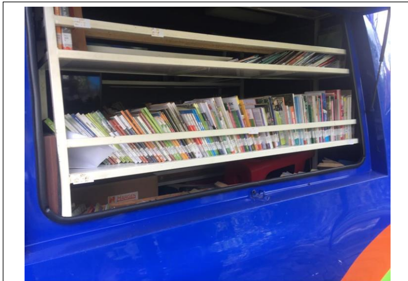
Koleksi Bahan Pustaka Perp. Keliling