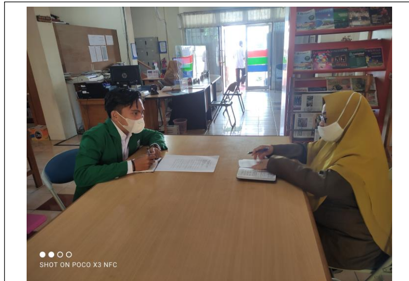
Wawancara dengan Kasi Pengelolaan Perpustakaan