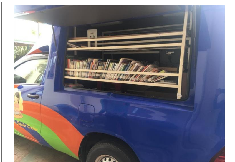
Koleksi Bahan Pustaka Perp. Keliling