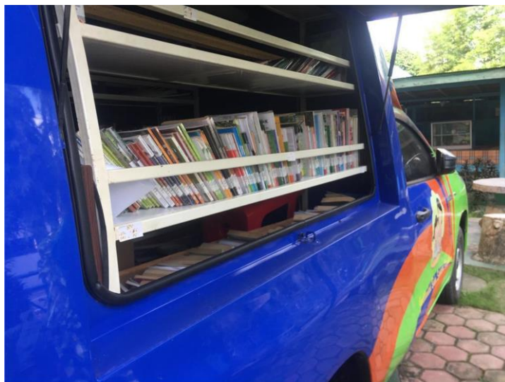
Koleksi Bahan Pustaka Perp. Keliling