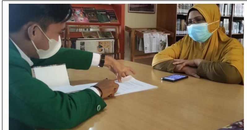
Wawancara dengan Kasi Perencanaan dan Keuangan