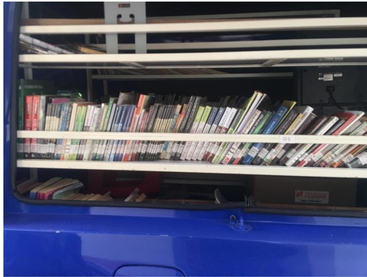
Koleksi Bahan Pustaka Perp. Keliling