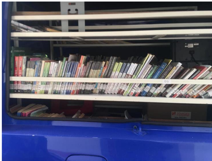
Koleksi Bahan Pustaka Perp. Keliling