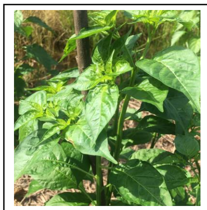
Gambar IV. Tumbuhan Cabe Rawit Hiyung ( Capsicum frutescens L.)