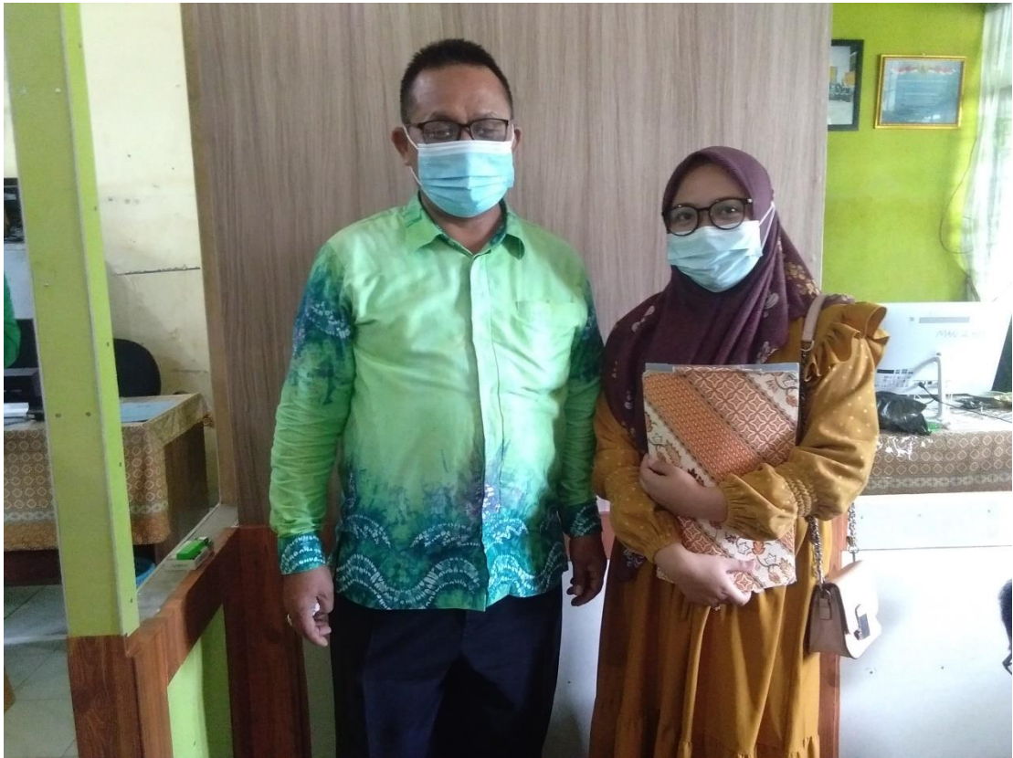
Foto bersama dengan kepala Tata Usaha MAN 2 Barabai