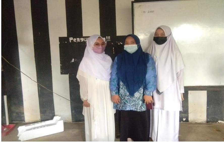
Foto bersama dengan siswa