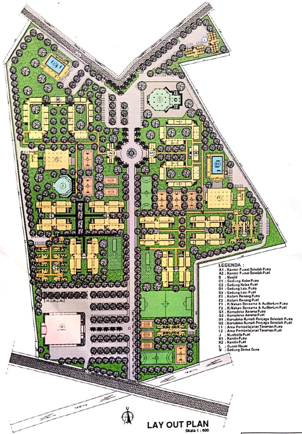
Gambar 4.2 Lay Out Plan Pondok Pesantren Darul Hijrah 2 Guntung Manggis Banjarbaru