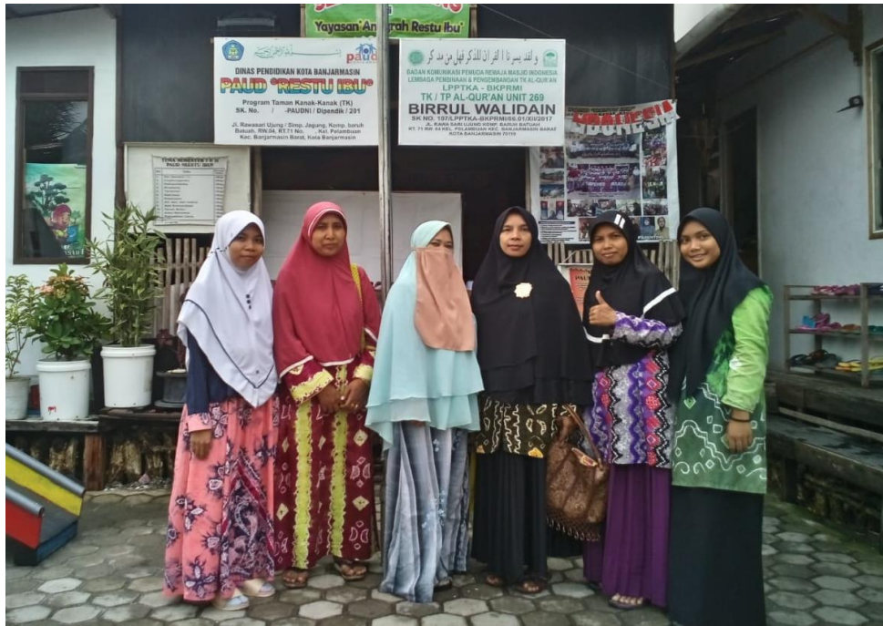
Foto bersama santri/santriwati TK/TPA Birrul Walidain