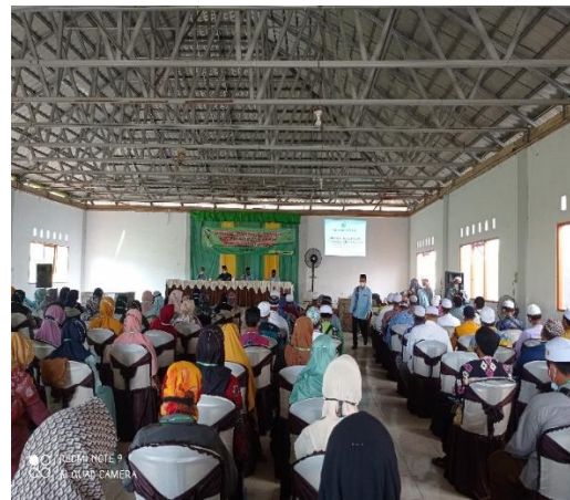
Kegiatan penataran kepala unit dan ustadz/ustadzah