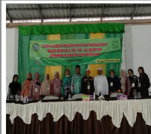
Bersama Kepala Unit dan Supervisor Kecamatan