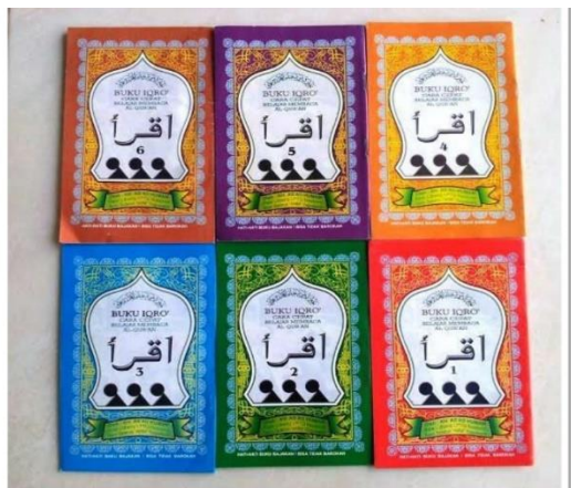
Buku Iqra yang digunakan oleh TKA/TPA