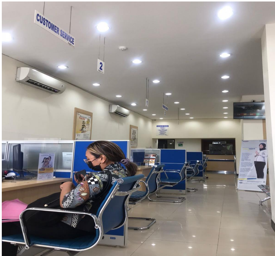
Gambar 4.2 Customer Service

9. Customer Service , tugas-tugasnya sebagai berikut :