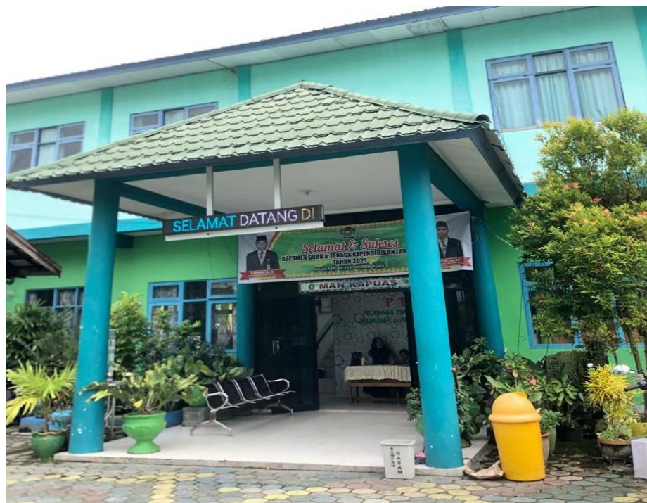
Halaman depan MAN Kapuas