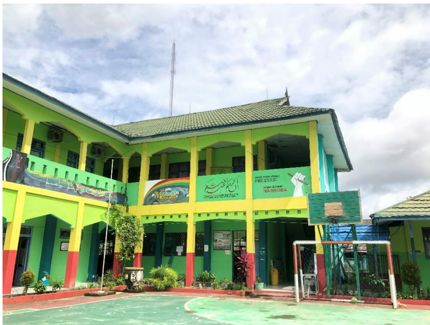
Lapangan MAN Kapuas