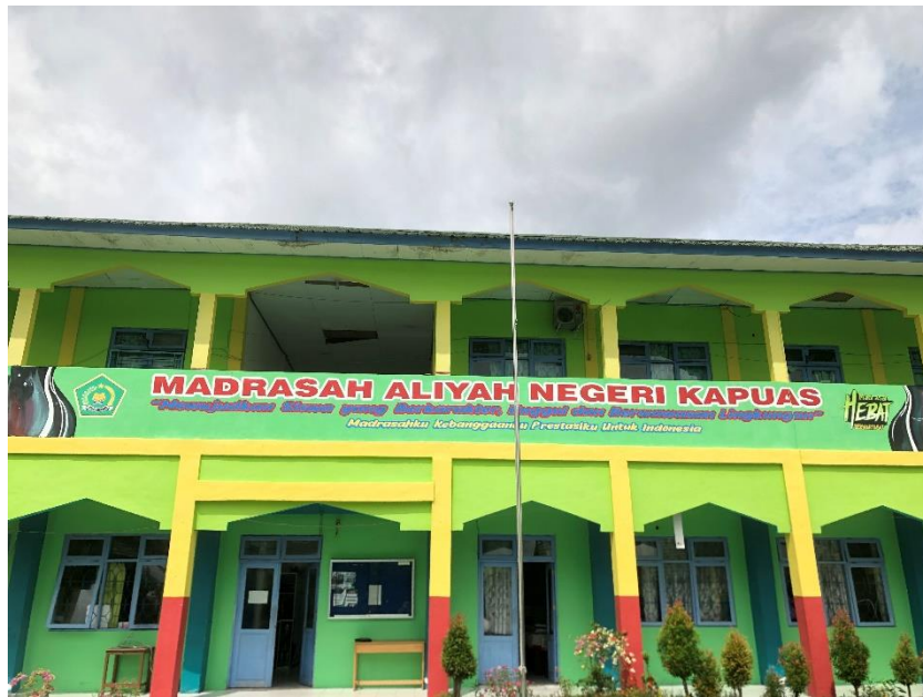
Bangunan kelas MAN Kapuas