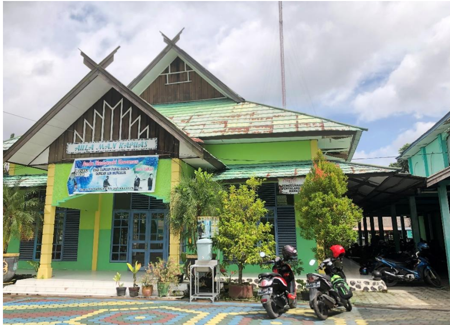
Aula MAN Kapuas