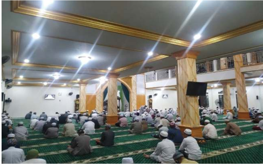
Foto Kegiatan Majelis Taklim