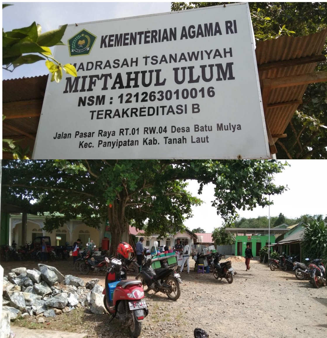
Foto Lingkungan Sekolah