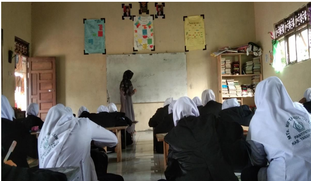
Keterangan foto: Guru menjelaskan perbedaan warna darah haid dan istihadah serta tanggal perhitungan haid dan istihadah