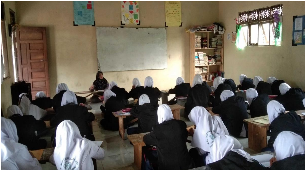
Keterangan Foto: Guru menterjemahkan kitab dan menjelaskan materi haid dan istihadah