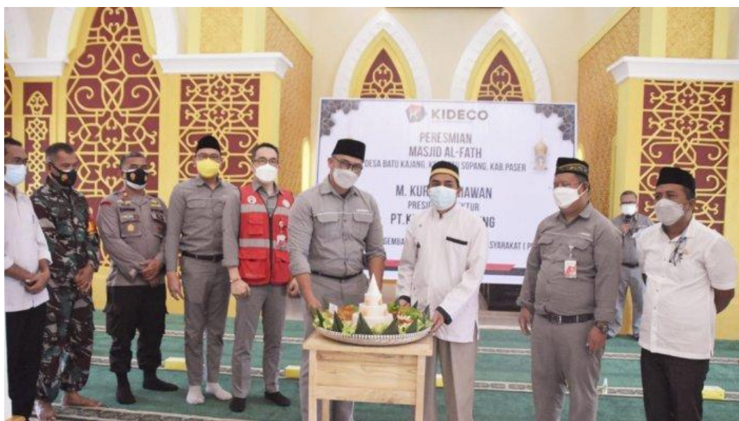
Gambar 4.4 Peresmian Masjid Al-Fath Pondok Pesantren Hidayatullah sekaligus penyerahan foto masjid dan penyerahan tumpeng oleh Presiden Direktur PT.KIDECO JAYA AGUNG

Dari berita diatas peneliti menemukan bahwa pihak CSR PT.KIDECO memiliki peran aktif dalam mendorong kemajuan pendidikan di Kabupaten Paser yang tentunya Desa Batu Kajang juga turut masuk dalam penerima manfaat di sektor pendidikan oleh CSR PT.KIDECO.