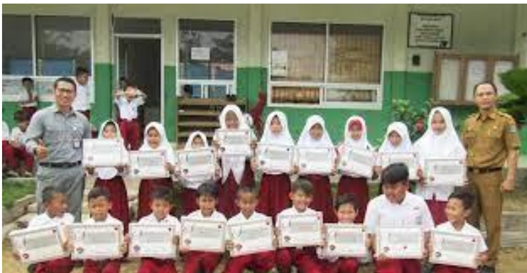
Gambar 4.3 Cover Berita “Kideco Bagikan Hadiah Untuk 1.833 Siswa Berprestasi”

Dari berita tersebut peneliti menemukan bahwa CSR dari perusahaan pertambangan batubara yaitu PT.KIDECO masih bergerak aktif hingga kini dalam memberikan tanggungjawab mereka terhadap masyarakat Desa Batu Kajang, salah satunya seperti diatas membantu mengurangi beban ekonomi dengan memberikan bingkisan berisikan sembako untuk masyarakat desa yang berdekatan dengan area pertambangan. Bantuan tersebut tidak hanya diberikan kepada Desa Batu Kajang, melainkan diberikan secara serentak kepada semua desa yang berada dalam Kabupaten Paser. Namun kembali ditekankan, bahwa bantuan tersebut hanya diberikan kepada Yayasan Pendidikan Sosial kepada yang benar-benar membutuhkan.