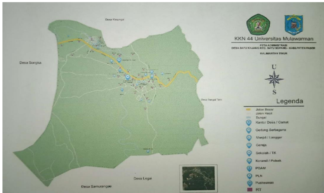
Gambar 4.1 Peta Desa Batu Kajang