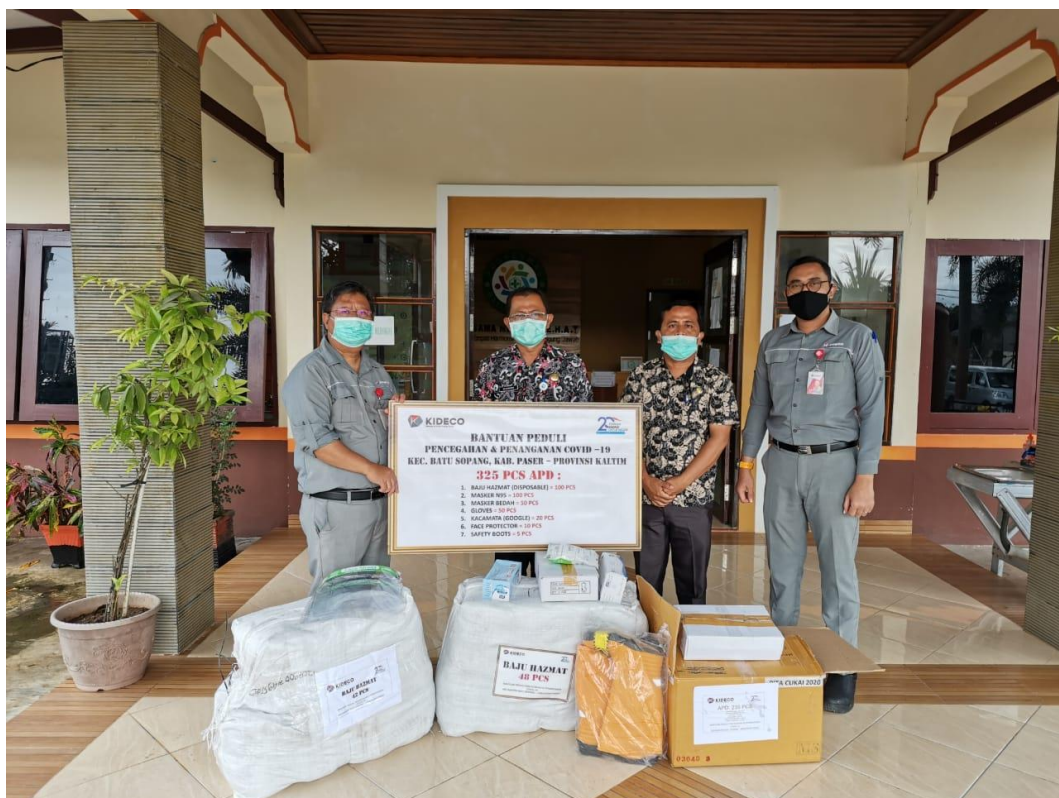
Gambar 4.5 PT.KIDECO JAYA AGUNG memberikan bantuan berupa Alat Pelindung Diri (APD) sebanyak 352 psc kepada Kecamatan Batu Sopang melalui Satuan Tugas Crisis Center COVID-19

Dari berita tersebut peneliti menyimpulkan Masjid Al-Fath di Pondok Pesantren Hidayatullah Paser yang terletak di Desa Batu Kajang mendapatkan bantuan yang berarti, sehingga peresmian juga dilakukan secara langsung oleh pihak Presiden Direktur PT.KIDECO saat masjid tersebut telah rampung. Adanya masjid ini juga menambah rumah ibadah umat muslim dan sangat penting perannya karena juga terletak dalam lingkungan pondok pesantren yang pasti akan banyak melakukan kegiatan di masjid tersebut.