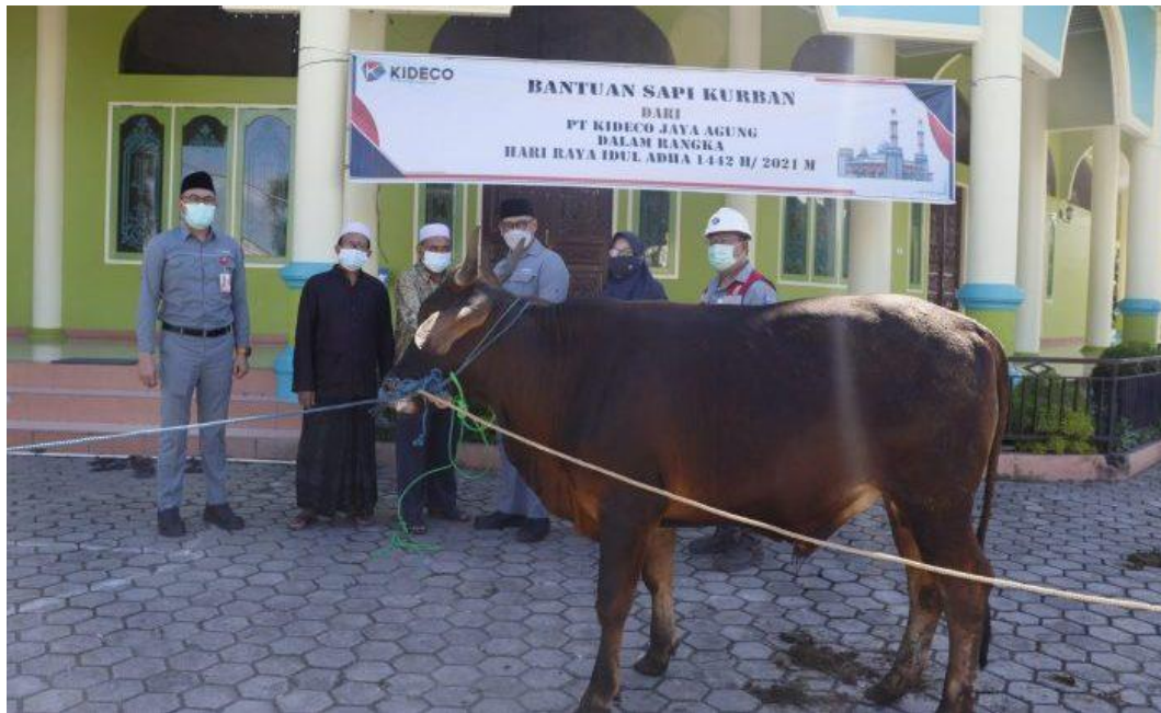
Gambar 4.6 PT. KIDECO JAYA AGUNG membagikan hewan kurban berupa sapi dalam rangka menyambut Hari raya Kurban 1442 H/2021 M

19 Juli 2021 PT. KIDECO JAYA AGUNG membagikan hewan kurban berupa sapi dalam rangka menyambut Hari raya Kurban 1442 H/2021 M, yang mana penyerahan hewan kurban tersebut sebagai rasa syukur juga sebagai bentuk kepedulian pihak perusahaan terhadap masyarakat yang berada di sekitar pertambangan. Melalui Program Pengembangan & Pemberdayaan Masyarakat (PPM) bidang Keagamaan Kideco membagikan 140 ekor sapi di 135 titik lokasi tersebar di 8 kecamatan, yang meliputi Masjid/Musholla, Pondok Pesantren, serta lembaga komunitas sosial lainnya. Saat itu, pendistribusian hewan kurban telah dilaksanakan oleh tim ER- Sustainability KIDECO sejak 10 – 19 Juli 2021, hal ini untuk memberikan kemudahan kepada para panitia/petugas kurban di lokasi masing-masing dalam hal pendistribusian daging kurban langsung kepada penerimanya.