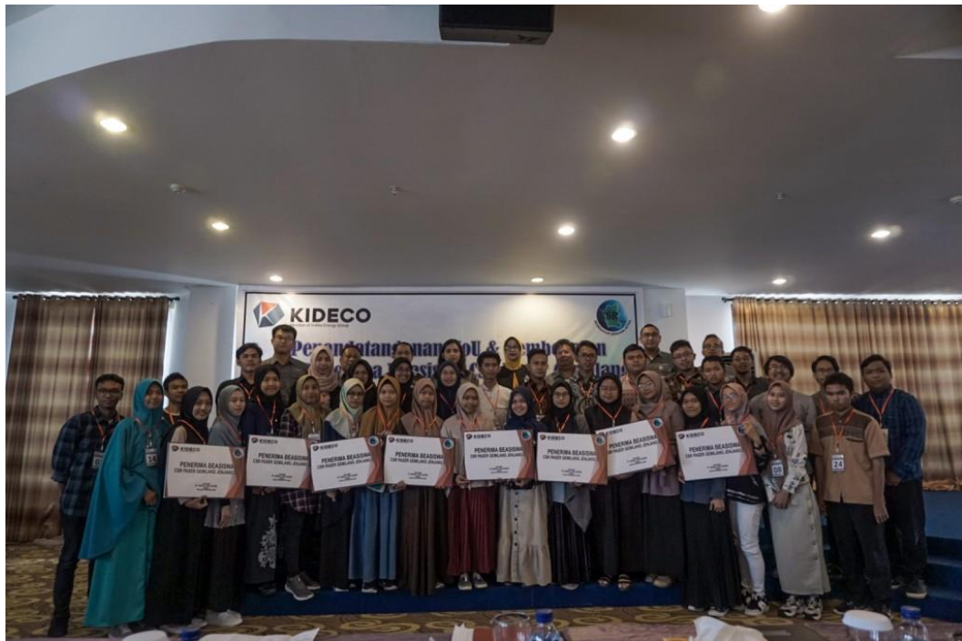
Gambar 4.9 34 Mahasiswa Paser Terima Beasiswa dari PT. KIDECO JAYA AGUNG

meningkatkan produktivitas dan ekonomi masyarakat, juga diharapkan galeri ini menjadi pusat oleh-oleh dan tempat memperkenalkan makanan serta kerajinan dari Desa Batu Kajang.