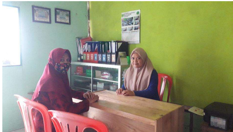
Gambar 4.6 Wawancara dengan Orang Tua NY