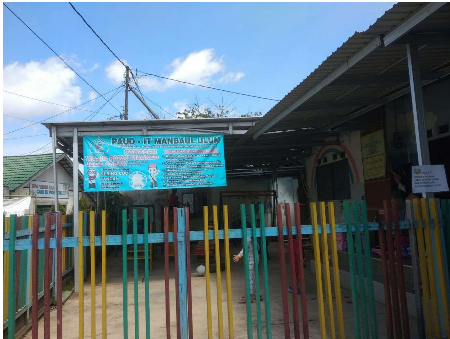
Gambar 4.2 Halaman PAUD-IT Manba'ul 'Ulum

Berdasarkan data yang peneliti dapat dari guru di PAUD-IT Manba'ul 'Ulum untuk sarana dan prasarana masih ada kekurangan seperti Ruang kelas, Ruang UKS. Halaman samping dan Perpustakaan, namun untuk kedepannya sudah ada rencana pembangunan dan perluasan pembentukan halaman serta melengkapi sarana belajar dan bermain.