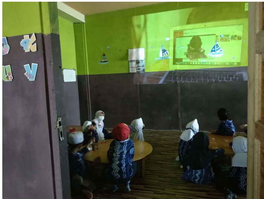
Gambar 4.4 Nonton Bersama Vlog Zara Cute