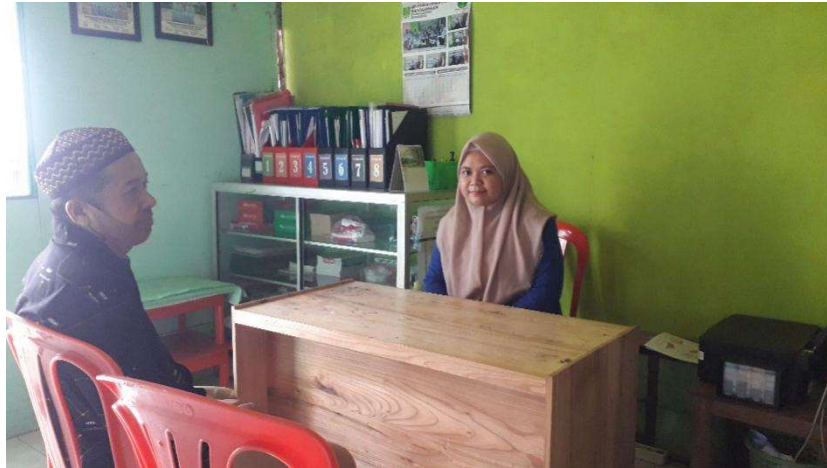
Gambar 4.9 Wawancara dengan Orang Tua I