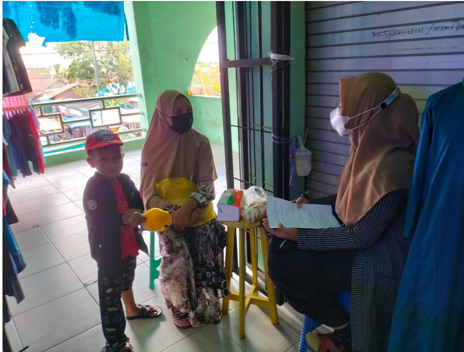
Foto dengan konsumen