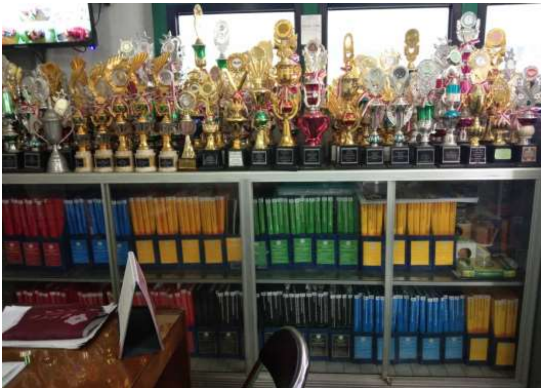
Beberapa hasil prestasi siswa