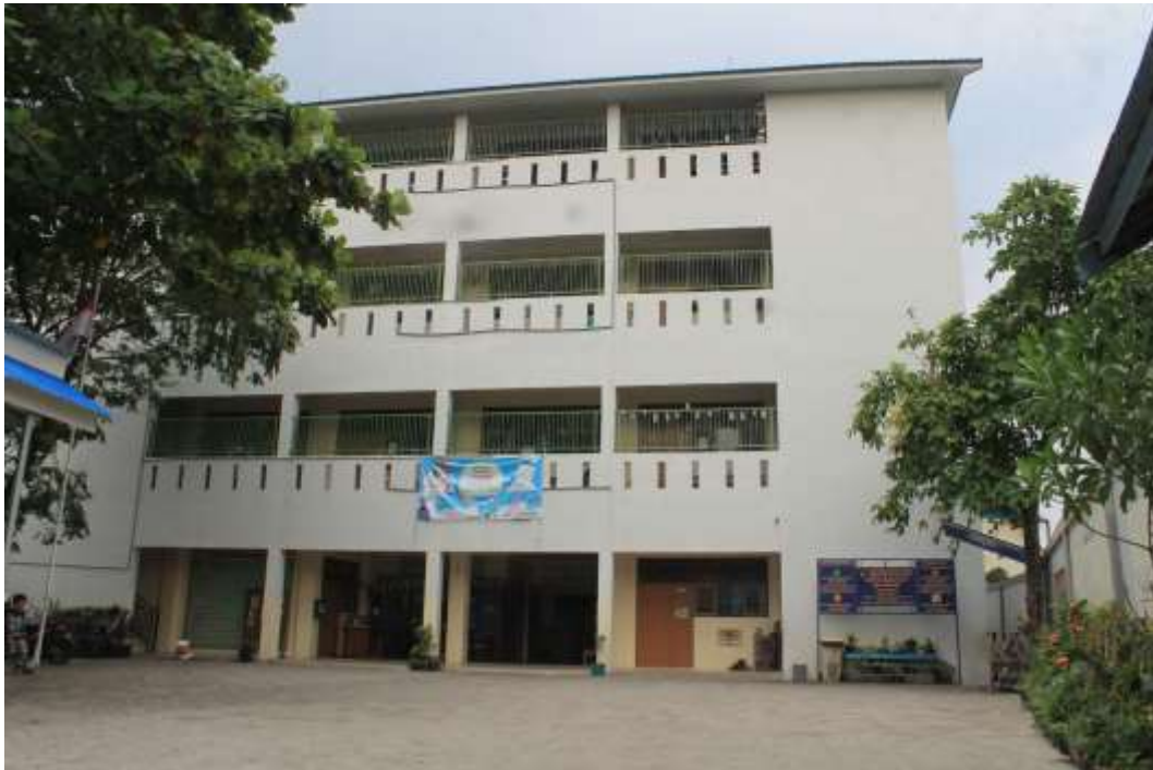
Gedung SD Muhammadiyah 9 Banjarmasin