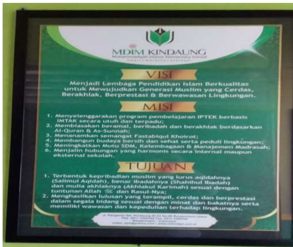
Visi mis MDIM 1 Banjarmasin