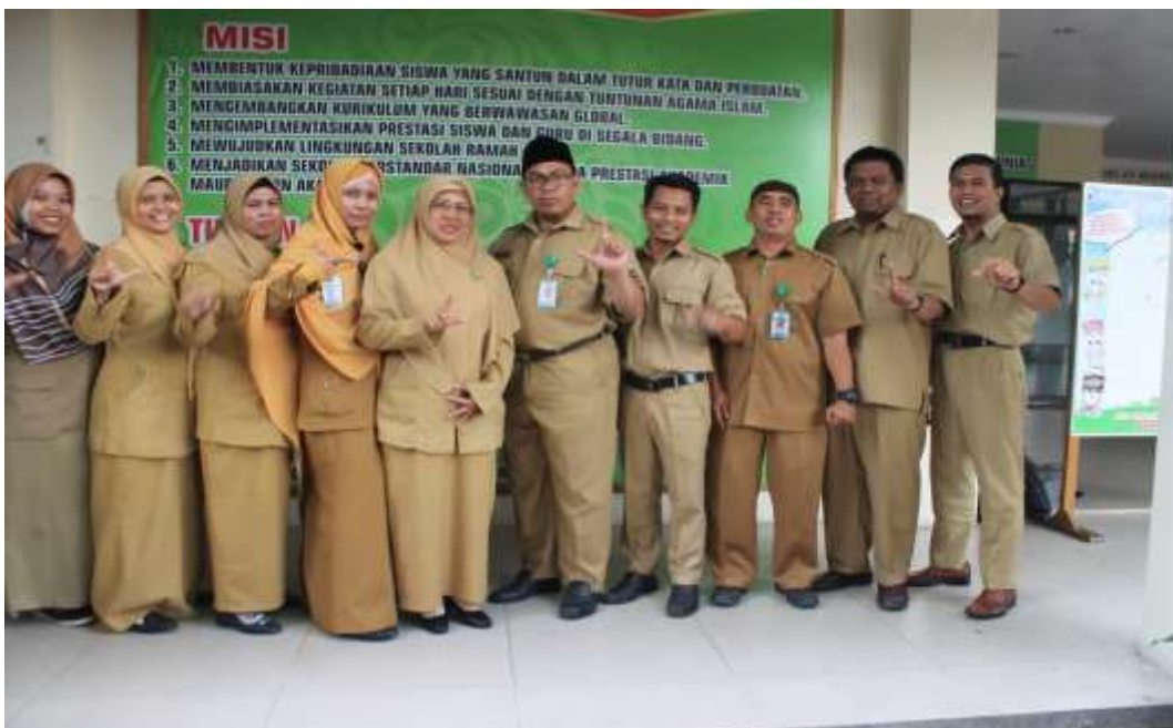
Photo Pimpinan SD Muhammadiyah 9 Banjarmasin