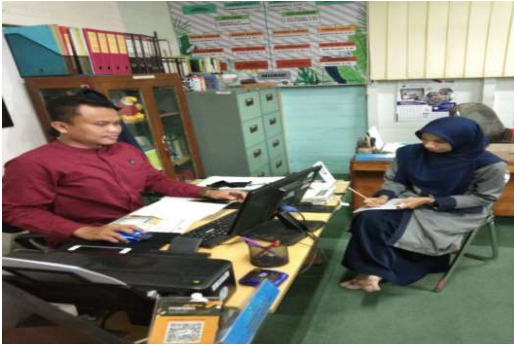
Pelaksanaan wawancara dengan KAUR kesiswaan