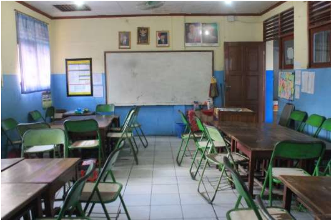
Ruang Belajar siswa