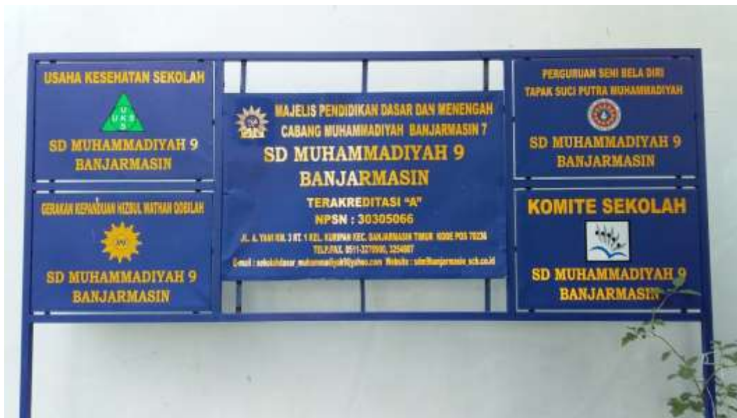
Papan nama SD Muhammadiyah 9