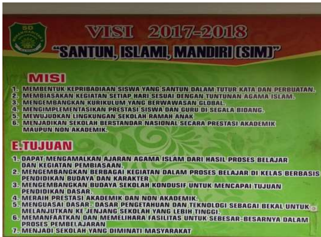
Visi misi SD Muhammadiyah 9