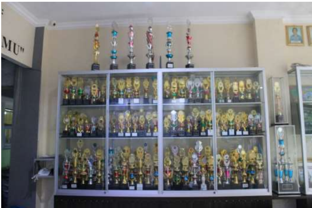
Gelery Prestasi siswa