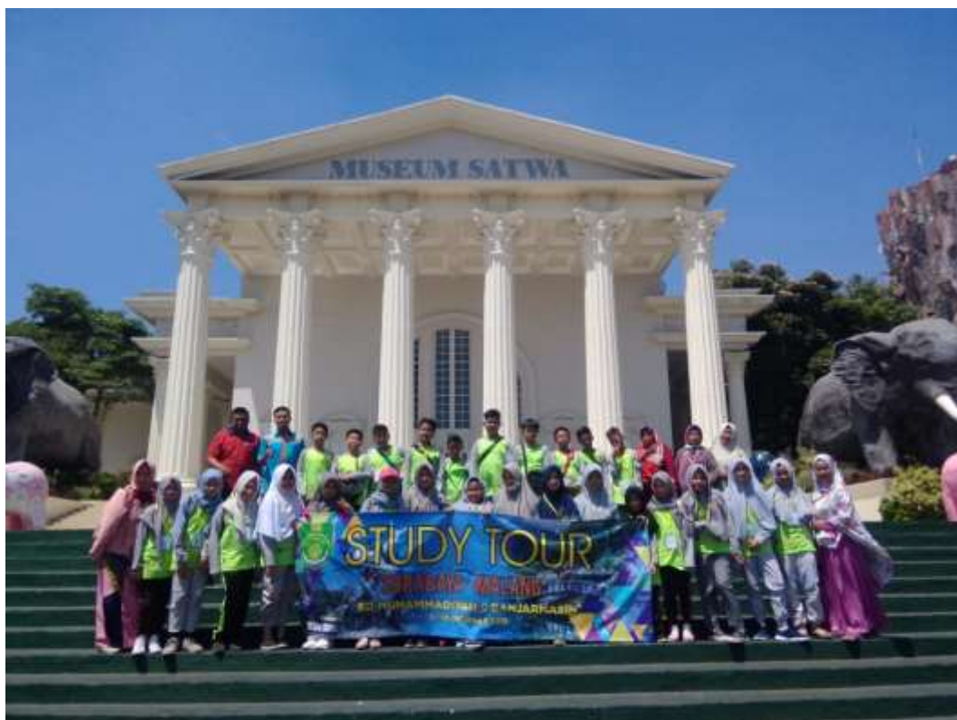
Study Tour Siswa