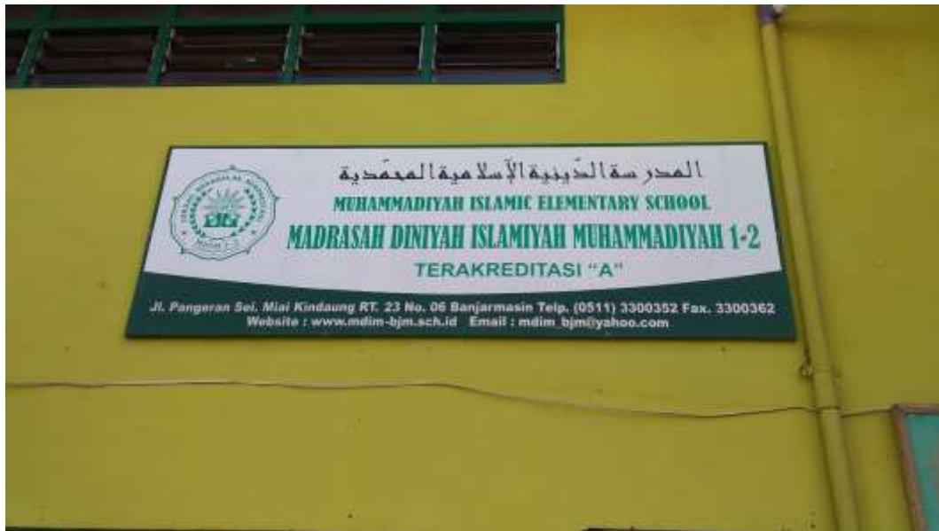
Papan nama MDIM 1 Banjarmasin