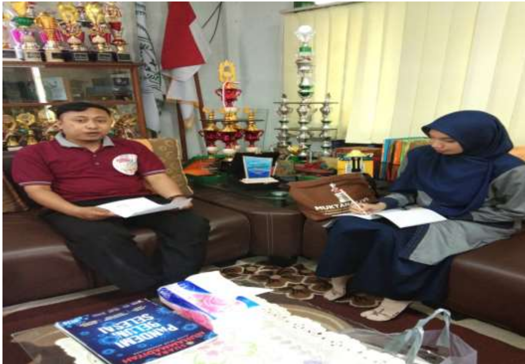
Pelaksanaan wawancara dengan Bapak kepala Madrasah