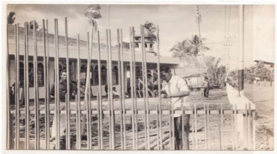
Gambar 4.1 Foto Masjid yang dulu

Masjid Al-Ikhwan Banjarmasin berasal dari Langgar yang namanya Langgar Al Jadid, dibangun sekitar tahun 1950. Tidak ada keterangan yang bisa dibuat alasan mengapa masyarakat merubah nama langgar, yang bermula bernama Langgar Al Jadid menjadi Langgar Al Ikhwan. Pada mulanya masyarakat yang tinggal di sekitar langgar Al Ikhwan ini untuk melaksanakan shalat jum'at, ada dua pilihan, kalau tidak pergi ke Mesjid Jami' di Pasar Lama, yang terdekat adalah ke Masjid Syafaah di Jalan Kuripan. Karena kedua mesjid tersebut letaknya lumayan jauh dan perkembangan penduduk di sekitar langgar terus bertambah, maka oleh jamaah pada sekitar tahun 1970, langgar tersebut difungsikan menjadi mesjid.