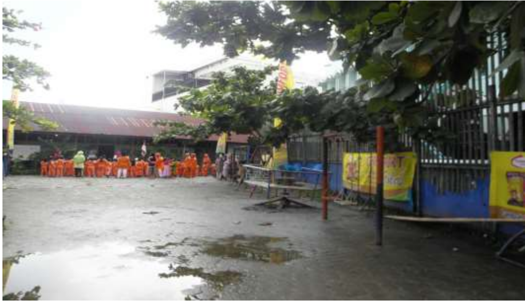
Gambar TK Al-Ikhwan 4.4