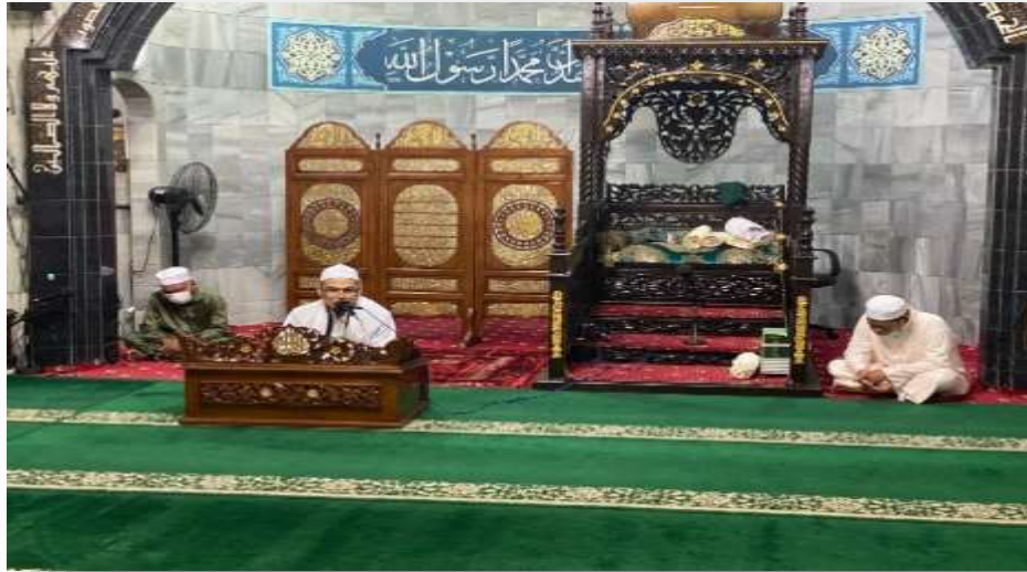
Gambar 4.7 Kegiatan dakwah Tauhid ustaz Ibnu Arabi M.,FII