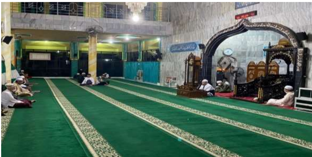
Gambar 4.9 Penghambat

Peneliti mengamati, selama berlangsung setiap minggunya pengajian di Masjid Al-ikhwan Banjarmasin, jamaah pengajian tidak selalu datang dengan banyak, akan tetapi salah satu pengajian setiap minggunya pasti ada yang lebih banyak jamaahnya. Hal ini karena jamaahnya sudah memilih dari jadwal pengajian ustaz siapa saja yang mereka ingin ikuti pengajiannya, Pengajian yang paling banyak menurut peneliti adalah pengajian yang dilaksanakan pada malam sabtu dan malam kamis, hal yang menarik dari pengajian ini yaitu dari segi bahasa penyampaiannya memakai bahasa daerah yang sangat mudah dipahami dari berbagai kalangan umur dan berbagai macam latar belakang pendidikan jamaah serta kadang-kadang diselingkan dengan humor yang membuat jamaah mendengarkan apa yang di sampaikan oleh dai sehingga jamaah tidak mengantuk dan selalu fokus untuk mendengarkan pengajian sampai selesai.