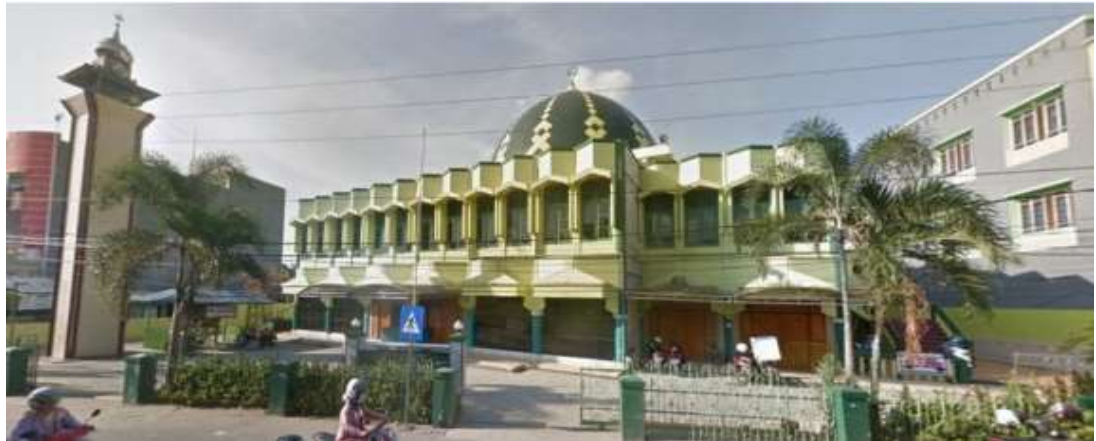
Gambar 4.2 foto masjid sekarang

oleh masyarakat diputuskan untuk dibangun kembali secara permanent lebih besar dan berlantai dua, seperti sekarang ini.