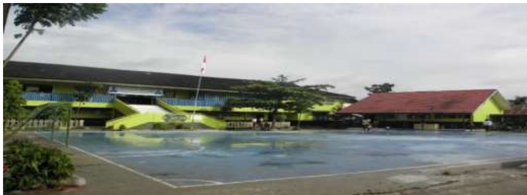
Gambar 4.3 MTS Al-Ikhwan Banjarmasin Timur