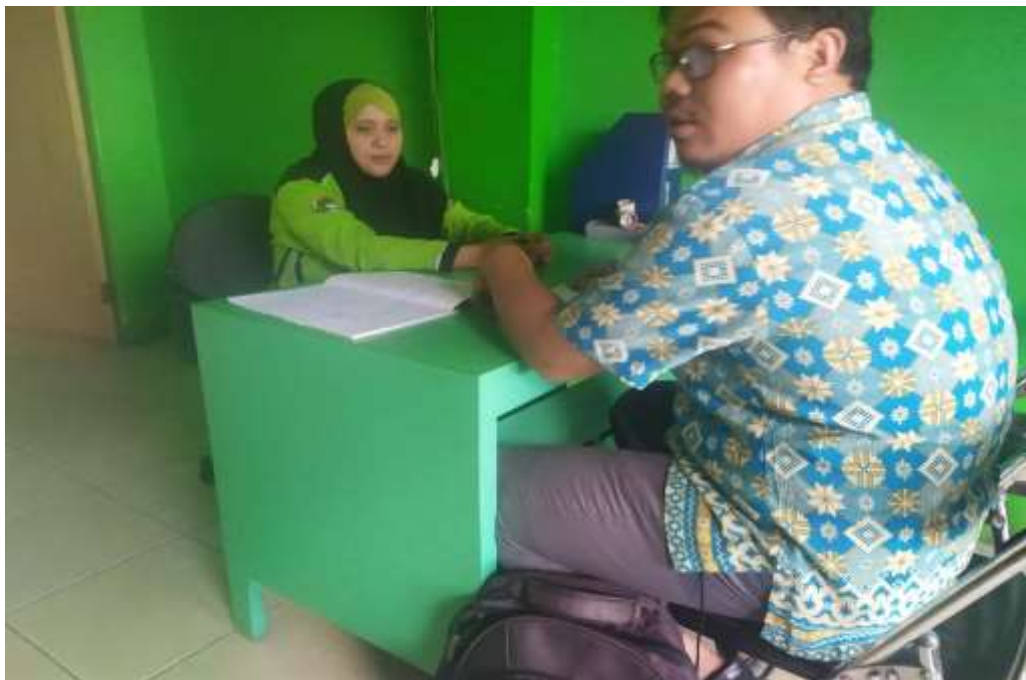
Foto. 02 Wawancara Manager BMT Bina Ummat Sejahtera Cabang Banjarmasin