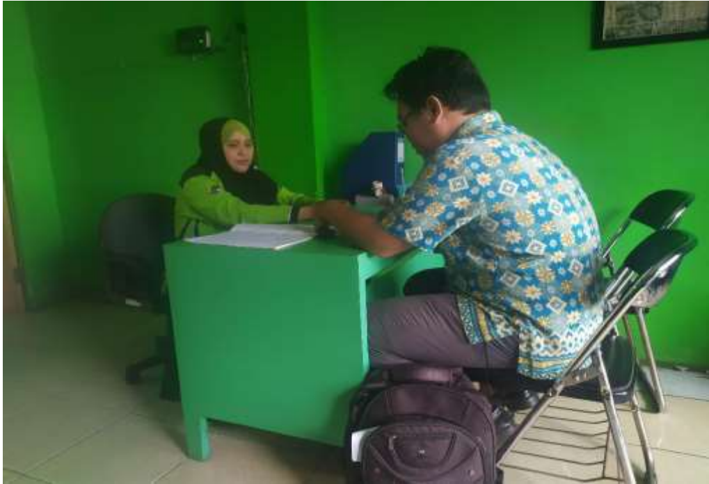
Foto. 01 Wawancara Manager BMT Bina Ummat Sejahtera Cabang Banjarmasin