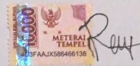
Reza Ikhlasul Amal