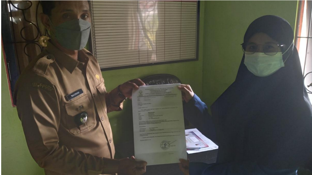
FOTO BERSAMA SEKALIGUS PELAKSANAAN WAWANCARA KEPADA PARA INFORMAN MASYARAKAT DESA TAMBAN SARI BARU YANG BERSTATUS SEBAGAI ORANG TUA