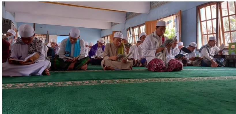
Photo: Kegiatan Tadarus Al-Qur'an Para Santri