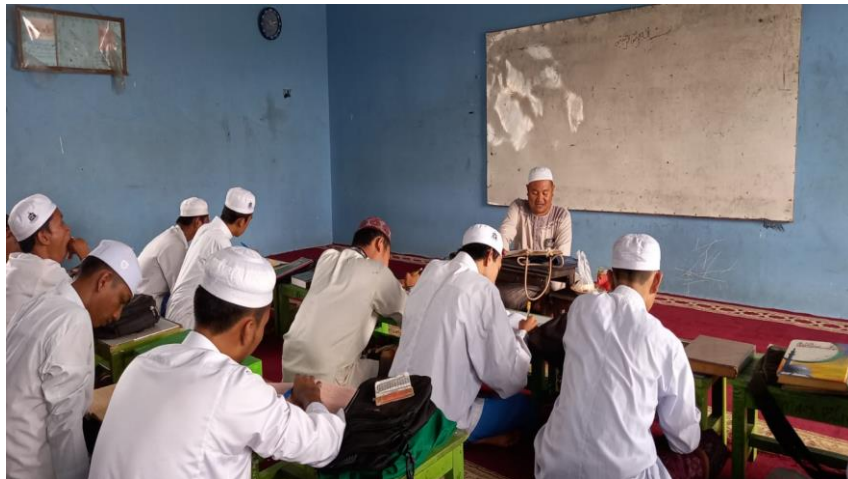
Photo: Wawancara dengan Santri di Asrama Selasa 22 Februari 2022