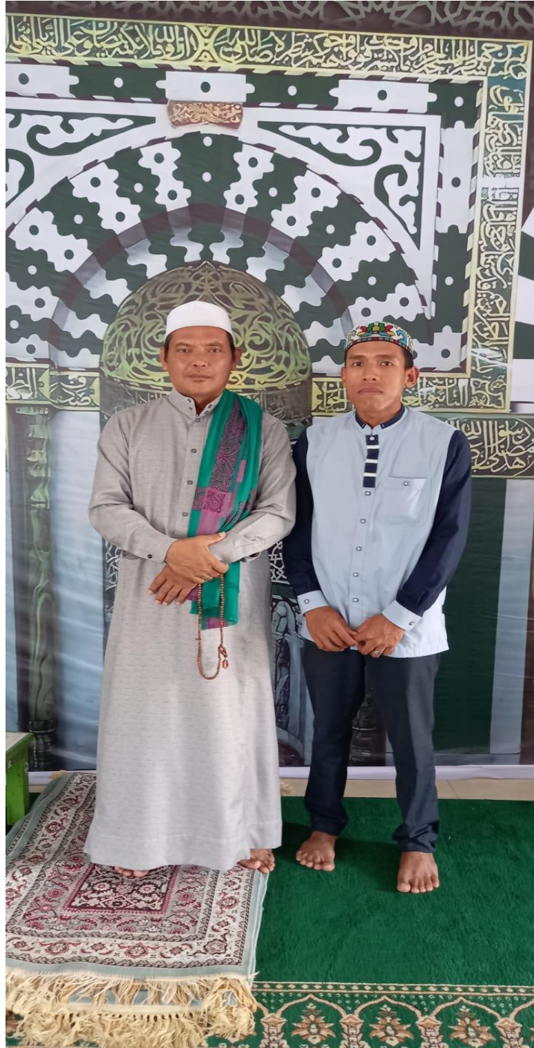
Photo: Bersama Pengasuh Pondok Pesantren Ishlahul Aulad