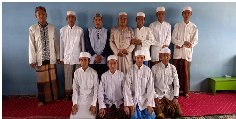
Photo: Bersama Santri Kelas 2 Wustha Pondok Pesantren Ishlahul Aulad