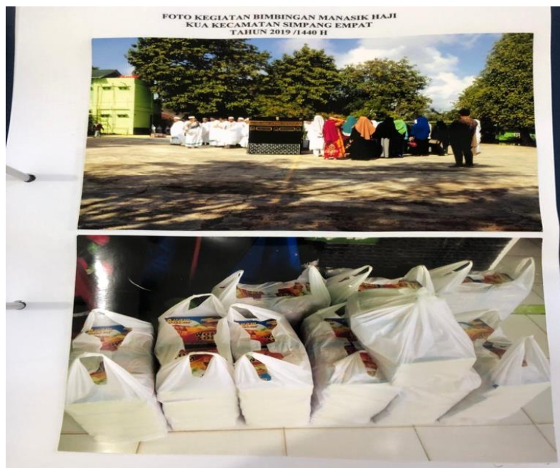
GAMBAR 4.3 Pengarahan Praktik Thawaf mengelilingi Ka'bah di KUA Kecamatan Simpang Empat