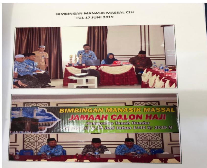
GAMBAR 4.2 Pengarahan Bimbingan Manasik Massal di Kementerian Agama Kabupaten Tanah Bumbu

Adapun yang dilaksanakan panitia untuk pelaksanaan manasik haji sebagai berikut: