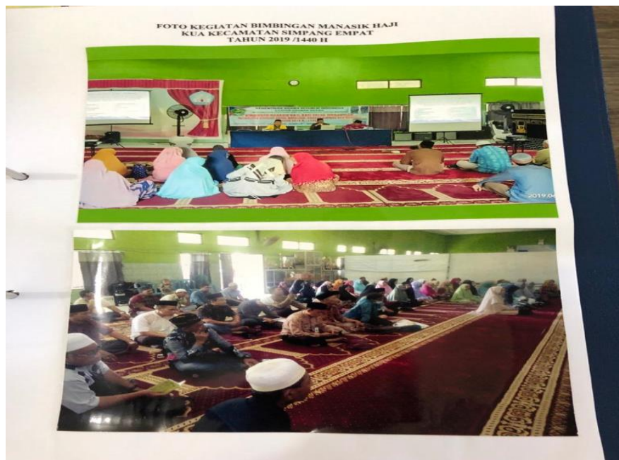
GAMBAR 4.1 Pengarahan Tekhnis Bimbingan Manasik Haji KUA Kecamatan Simpang Empat