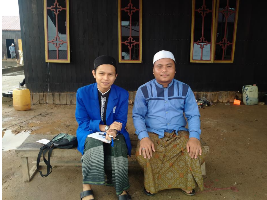
Gambar. 1. 4