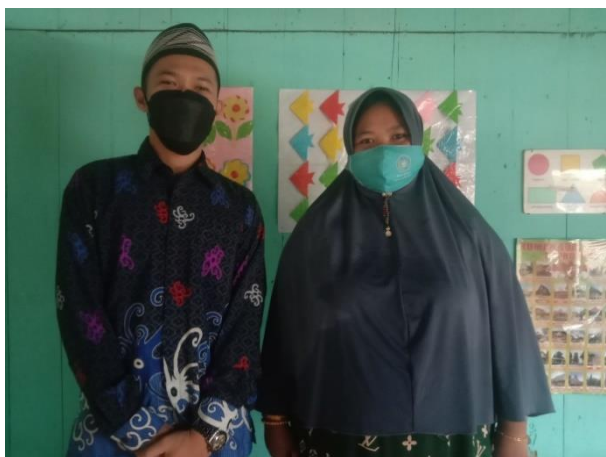
Bersama responden 3