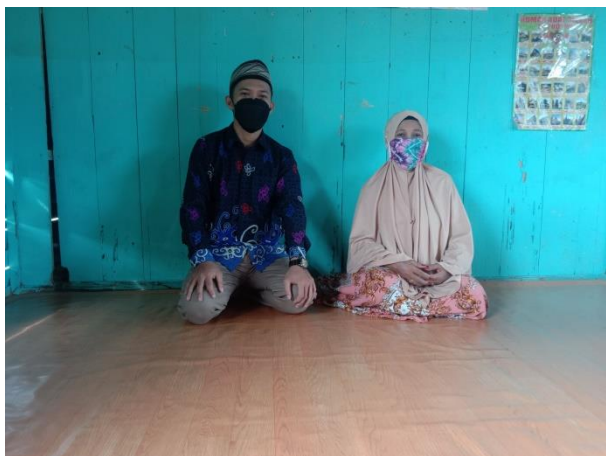
Bersama kepala unit TPA/ responden 1