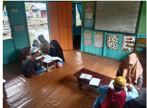
Suasana pembelajaran al-Qur'an