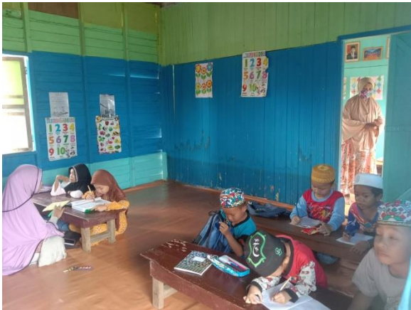
Suasana pembelajaran Iqro'