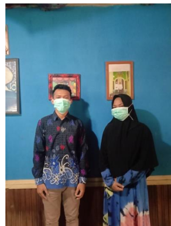
Bersama responden 2