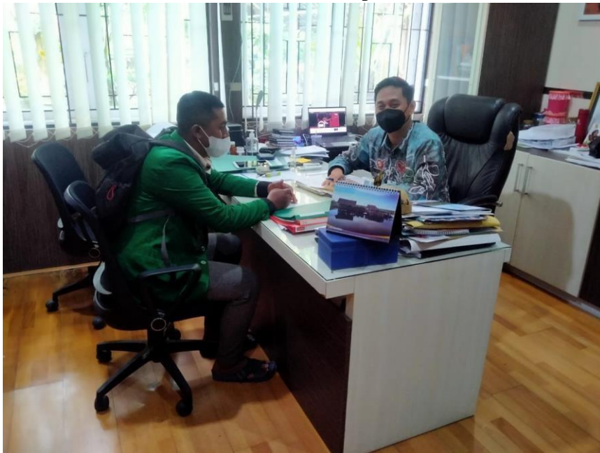
Foto bersama bapak RPP