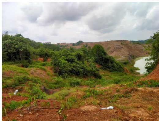
Gambar 4.2, Sumber: dari data primer, (2022)

Berdasarkan tiga unsur di atas, bahwa implementasi yang dijalankan PT. BAS tidak ada yang memenuhi ketiga unsur tersebut. Pertama, program reklamasi yang tidak dijalankan, kedua kelompok masyarakat yang dirugikan karena lahan perkebunan menjadi rusak akibat pertambangan batubara, dan ketiga tidak adanya tanggung jawab dari PT. BAS atau pihak pengawas yakni pemerintah daerah Kabupaten Hulu Sungai Selatan.