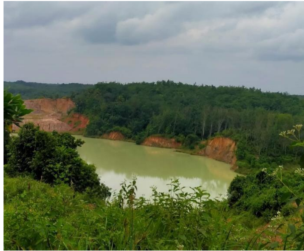
Gambar 4.1, Sumber: dari data primer, (2022)

Kegiatan pertambangan batubara merupakan kegiatan eksplorasi sumber daya alam yang tidak dapat diperbaharui. Di mana di dalam kegiatan pertambangan dapat berdampak pada rusaknya ekosistem. Ekosistem yang rusak bisa diartikan suatu ekosistem yang tidak dapat lagi dijalankan fungsinya secara optimal. Seperti dimulai dengan pembukaan tanah pucuk dan tanah penutup serta pembongkaran batubara yang mana kegiatan tersebut berpotensi terhadap perubahan bentang alam yang mengakibatkan adanya lubang-lubang yang besar yang dihasilkan dari kegiatan pertambangan batubara. Seharusnya lubang-lubang tersebut harus ditutupi melalui kegiatan reklamasi yang diatur dalam Undang- Undang Republik Indonesia Nomor 3 tahun 2020 Tentang Pertambangan Mineral dan Batubara. 55 Namun, pada kenyataannya perusahaan pertambangan batubara OT. Borneo Alam Semesta meninggalkan lubang-lubang tambang yang besar.