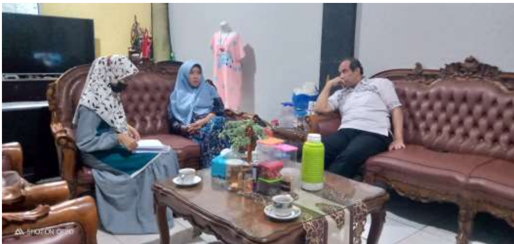
Wawancara dengan Mustahik