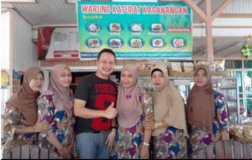
(Beberapa Foto Bersama Pelanggan Ternama)