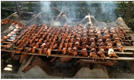
(Proses Pengasapan Ikan)