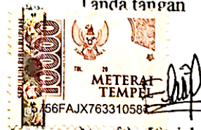
Nur Ely Fitriah