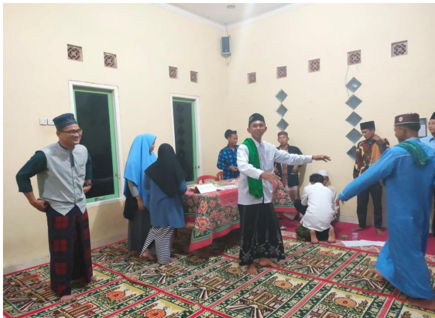
Gambar 4.3 : Dokumentasi Setelah Selesai Belajar Salat Wajib di TPA al-Haromain

diperhatikan oleh santri-santri yang lainnya. Kemudian setelah masuk salat isya para santri dipersilahkan untuk berwudhu dan siap-siap untuk melaksanakan salat isya berjamaah kemudian setelah salat isya berjamaah ustadz memimpin untuk zikir, kemudian doa dan setelah itu ustadz memberikan nasihat lalu ditutup dengan ucapan salam dan shalawat bersama-sama dan trakhir para santri bersalaman dengan ustadz dan ustadzahnya kemudian pulang ke rumah masing-masing.