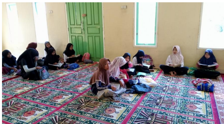
Gambar 4.2 : Dokumentasi Saat Pembelajaran Tahsin TPA al-Haromain

dijelaskan bacaannya bagi santri-santri yang salah membaca kemudian dinaikan ke ayat selanjutnya atau lembar selanjutnya bagi santri-santri yang sudah bisa dan lancar bacaan Al-Qur'annya. Setelah satu-persatu maju kemudian ustadz atau ustadzahnya memberikan nasihat kepada santri-santri TPA al-Haromain terakait yang sudah dipelajari setiap harinya dan tentu saja nasihat-nasihat lainnya dan setelah itu ustadz atau ustadzahnya menutup pertemuan dengan bersama-sama membaca doa khotmil qur'an secara bersamaan kemudian ditutup dengan ucapan salam oleh ustadz dan ustazah TPA al-Haromain dan trakhir sebelum keluar para santri bersalaman dengan ustadz dan ustazah TPA al-Haromain Desa Galang Tinggi.