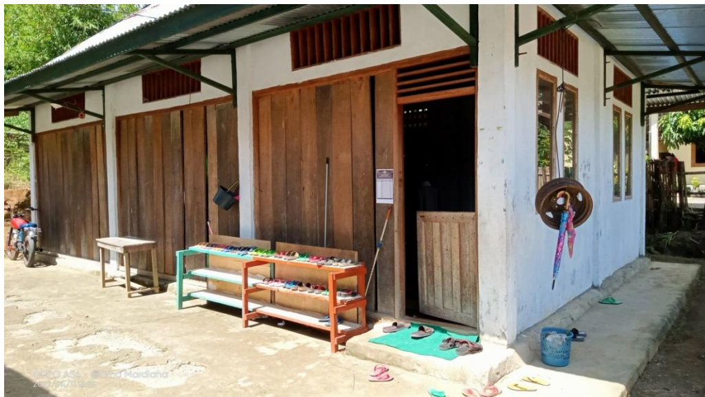
Gambar 4.1 : Ruang Belajar TPA al-Haromain