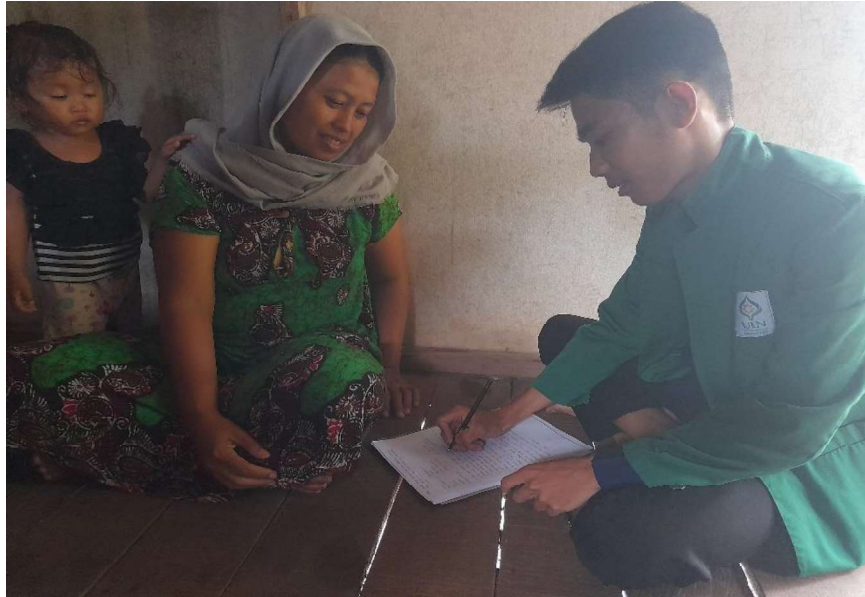
Wawancara bersama Ibu salasih (Responden 4)