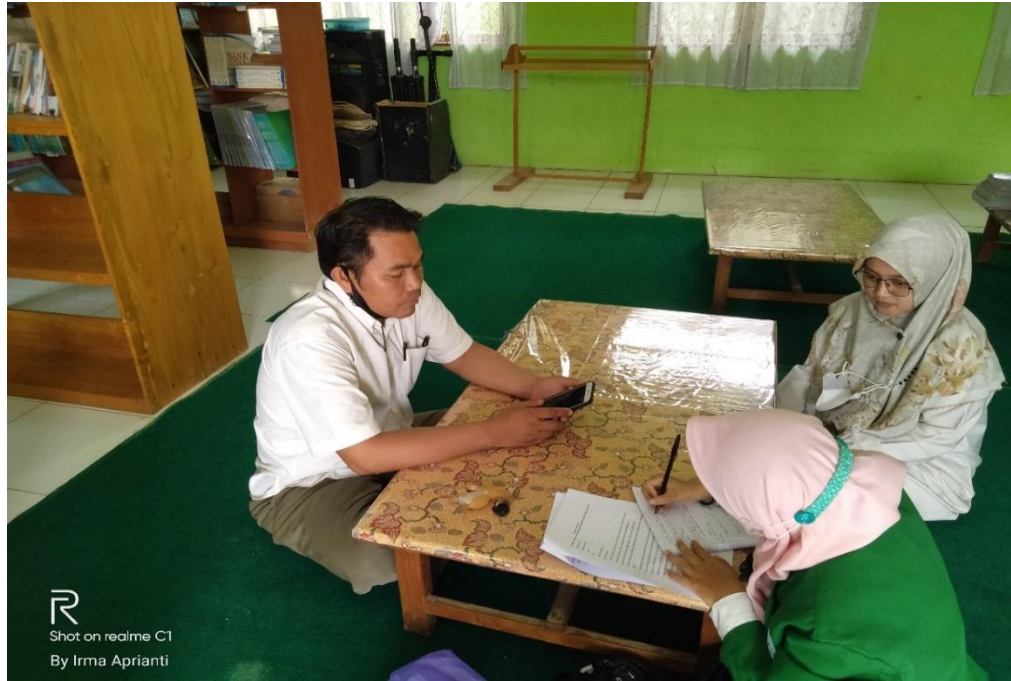
d. Wawancara bersama Murid di MAPK NU Haruyan