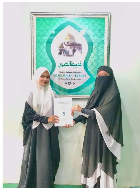
Penyerahan Proposal Skripsi