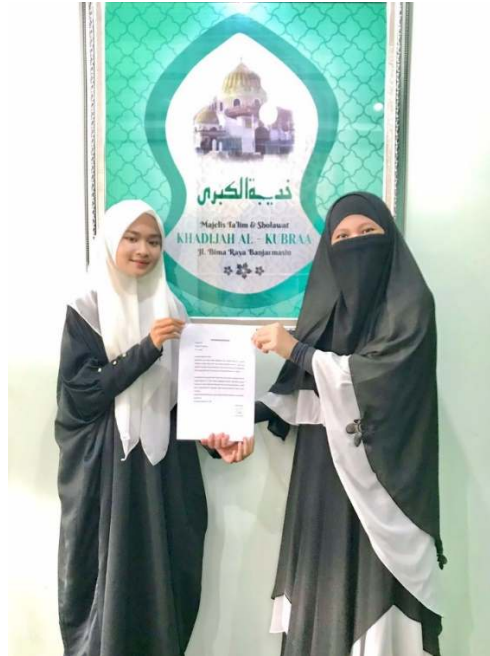
Penyerahan Surat Izin Riset kepada Pimpinan Majelis Ta'lim Khadijah