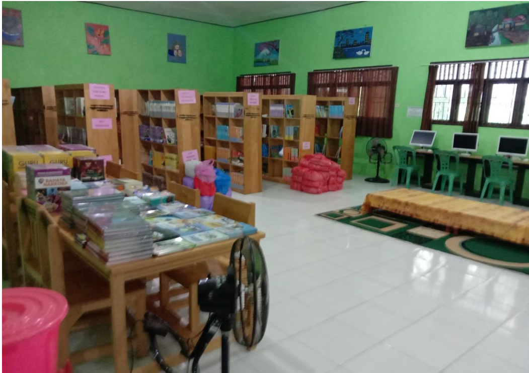
Rak Buku dan Tempat Baca Perpustakaan