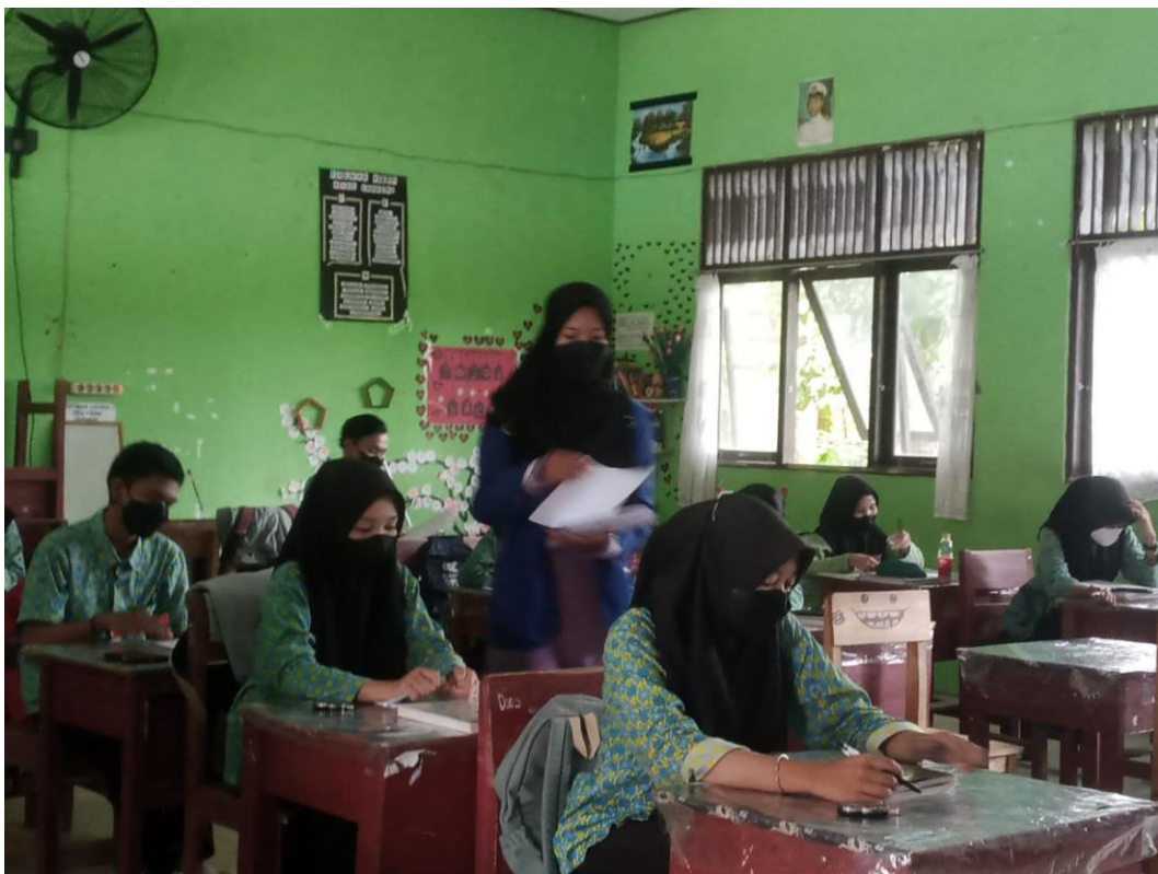
Foto pembagian angket