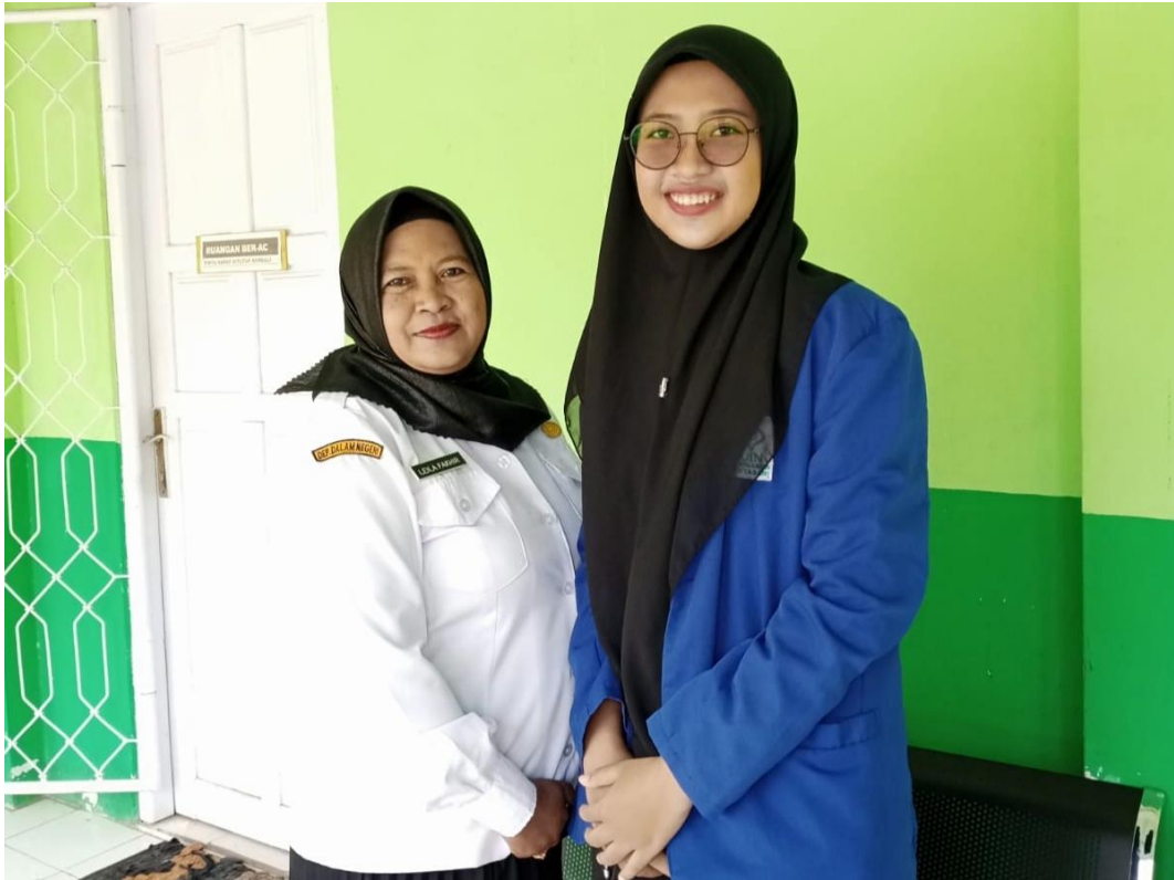
Foto Bersama Ibu Kepala Perpustakaan