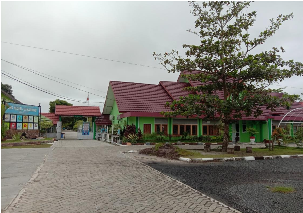
Halaman Depan SMAN 4 Banjarbaru